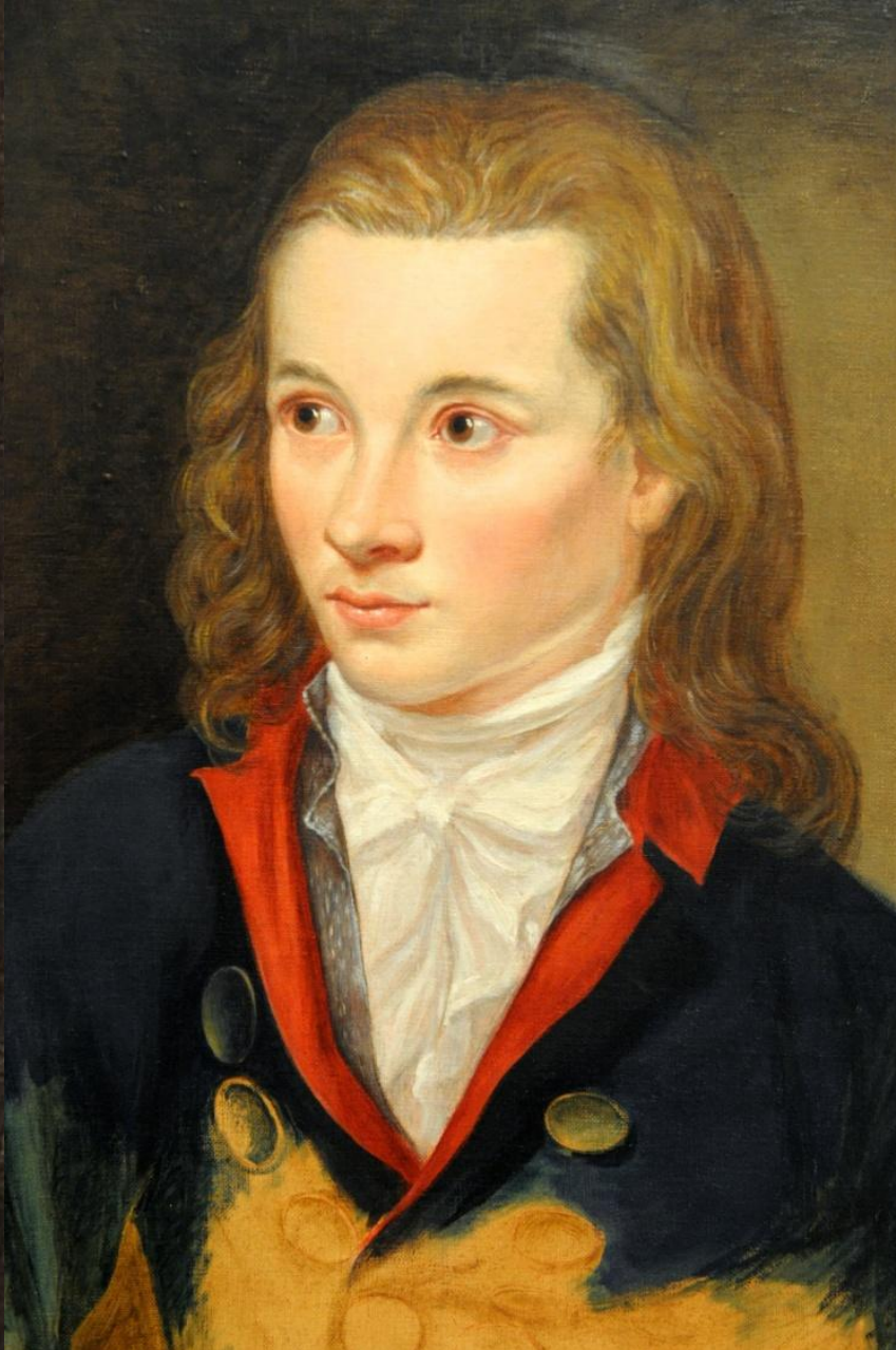
Новалис (Фридрих фон Гарденберг) (1772-1801)