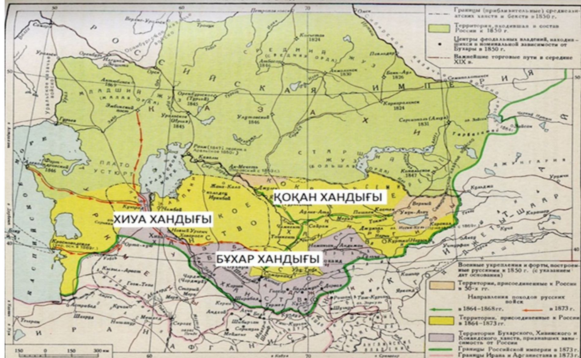
КАЗАХСТАН И СРЕДНЯЯ АЗИЯ к 1873 г.