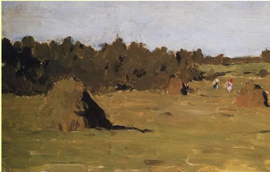
И. И. Левитан «Сенокос»

Край любимый! Сердцу снятся Скирды солнца в водах лонных.