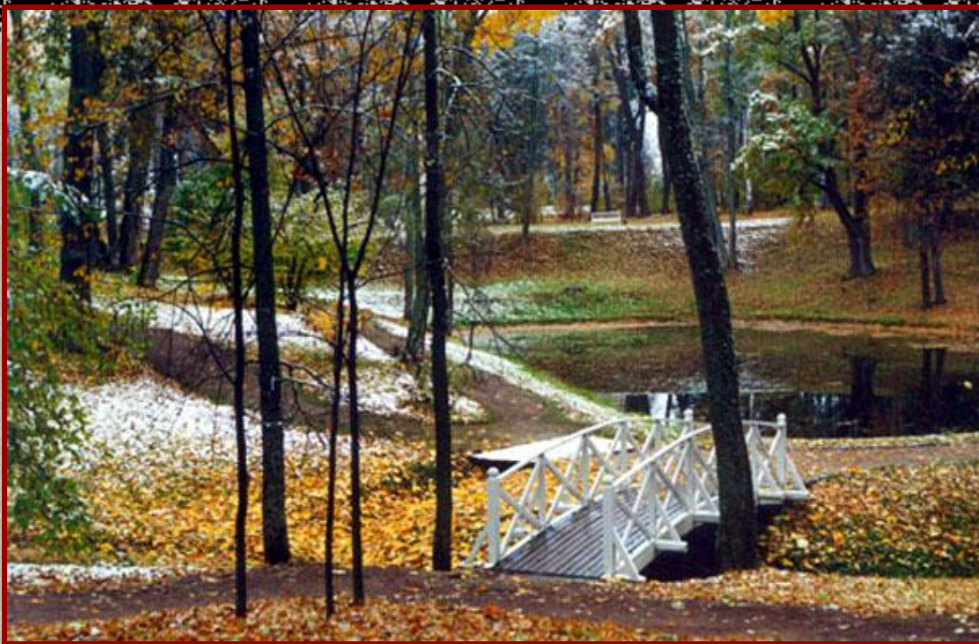
Тригорское. Парк .

Прошло 6 лет, и Пушкин вновь увидел Керн в 1825 году, когда она гостила в Тригорском.