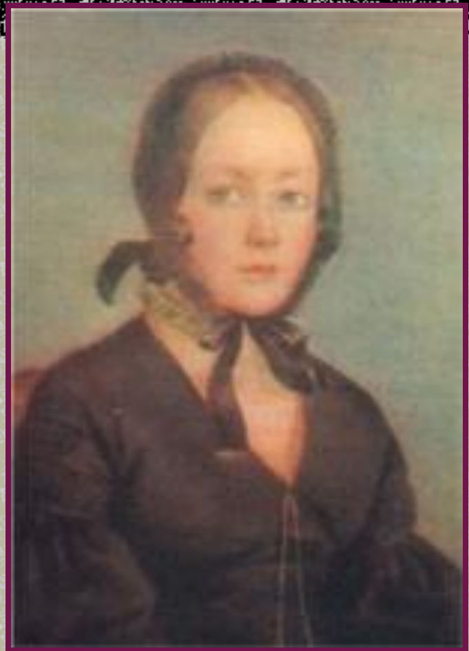
А.П.Керн. Портрет работы А. Арефьева- Богаева.

Вы такой представляли себе ту, которой посвящено стихотворение «Я помню чудное мгновенье»?