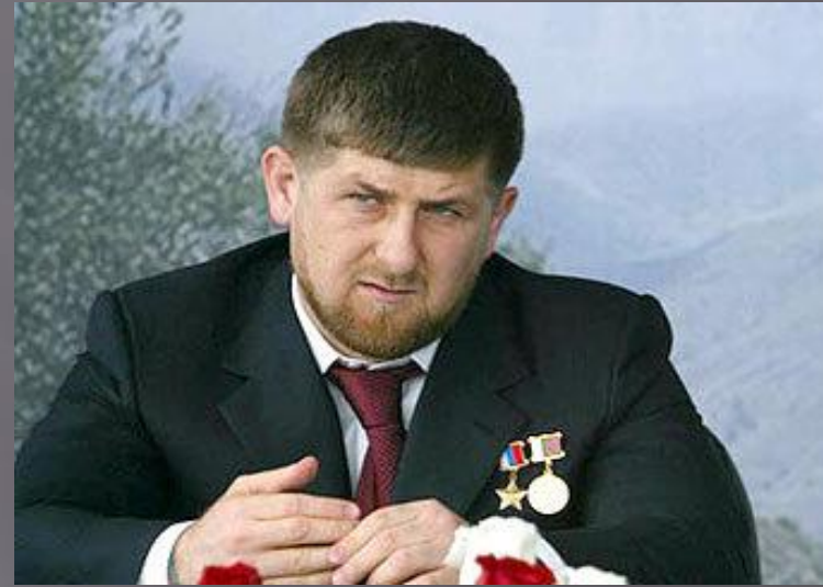
Глава Чеченской Республики – Рамзан Ахматович Кадыров.

Именно период правления Рамзана Кадырова ознаменовался крупномасштабным строительством и восстановлением инфраструктуры Чечни, которые стали возможными преимущественно благодаря дотациям из федерального бюджета. Так, в 2008 году руководитель администрации президента России Сергей Нарышкин объявил о выделении 120 млрд рублей на финансирование целевой программы местных властей