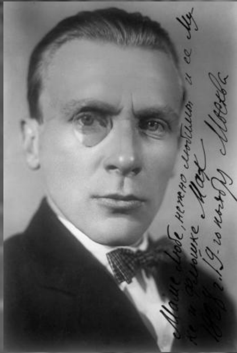
Михаил Афанасьевич Булгаков (1891 – 1940) – русский писатель, драматург, режиссер, один из лучших авторов первой половины XX века