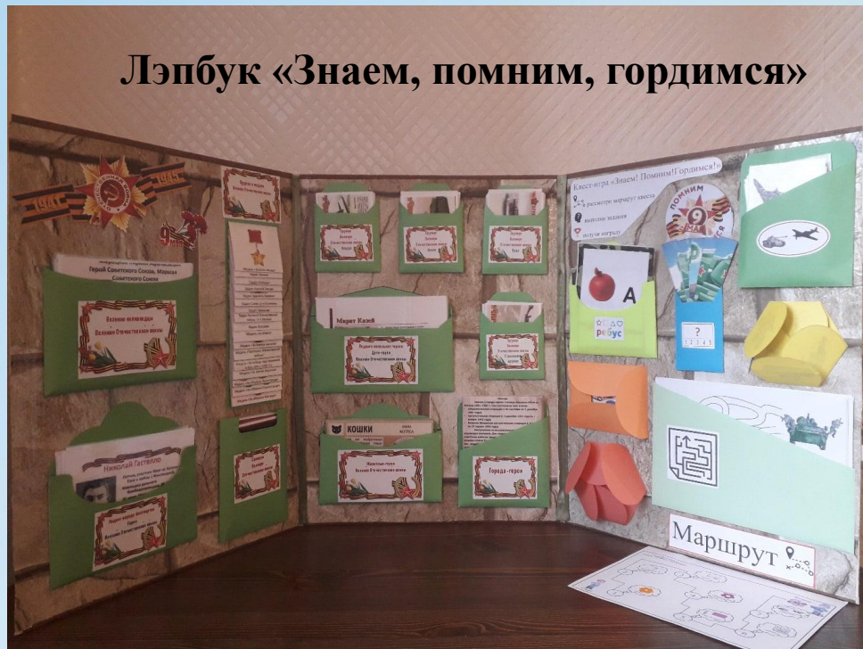
Лэпбук «Знаем, помним, гордимся»