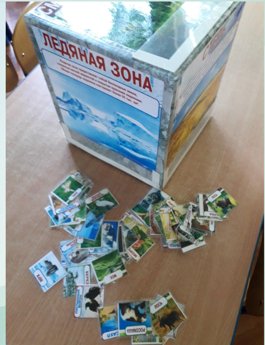
Дидактическое пособие «Экологический куб»