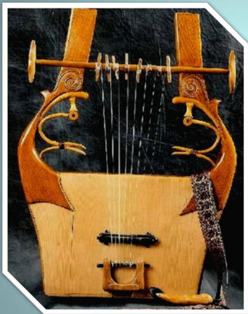
Кифара- древнегреческий струнный- щипковый инструмент