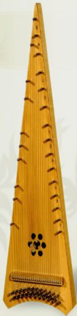
Псалтерий, альт Alto psaltery