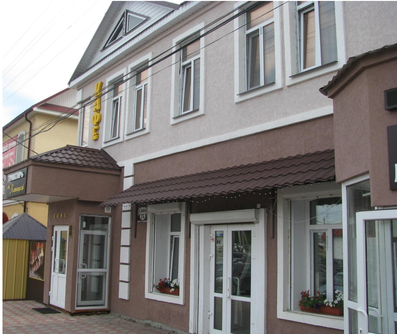
Кафе «Трактир на Пятницкой»