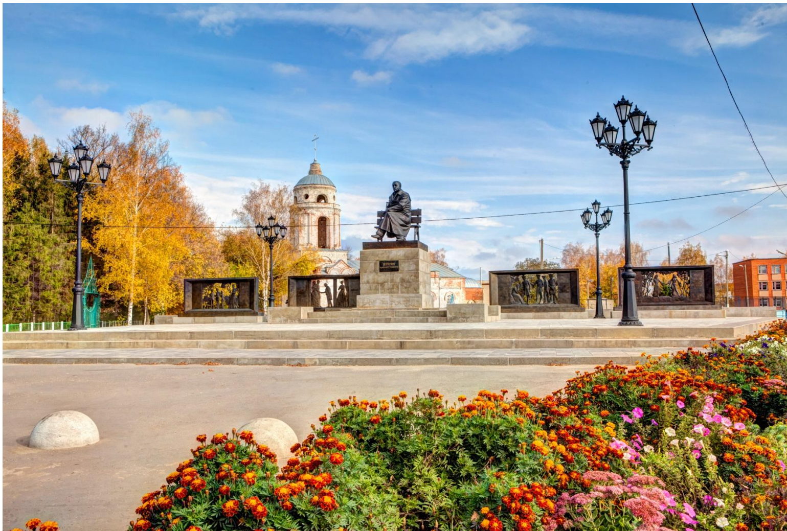
Памятник А.И. Куприна