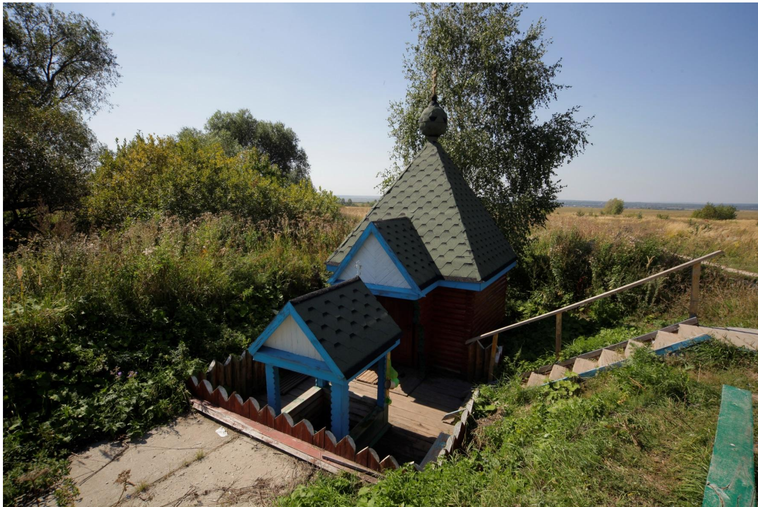
Источник Святителя Николая Чудотворца