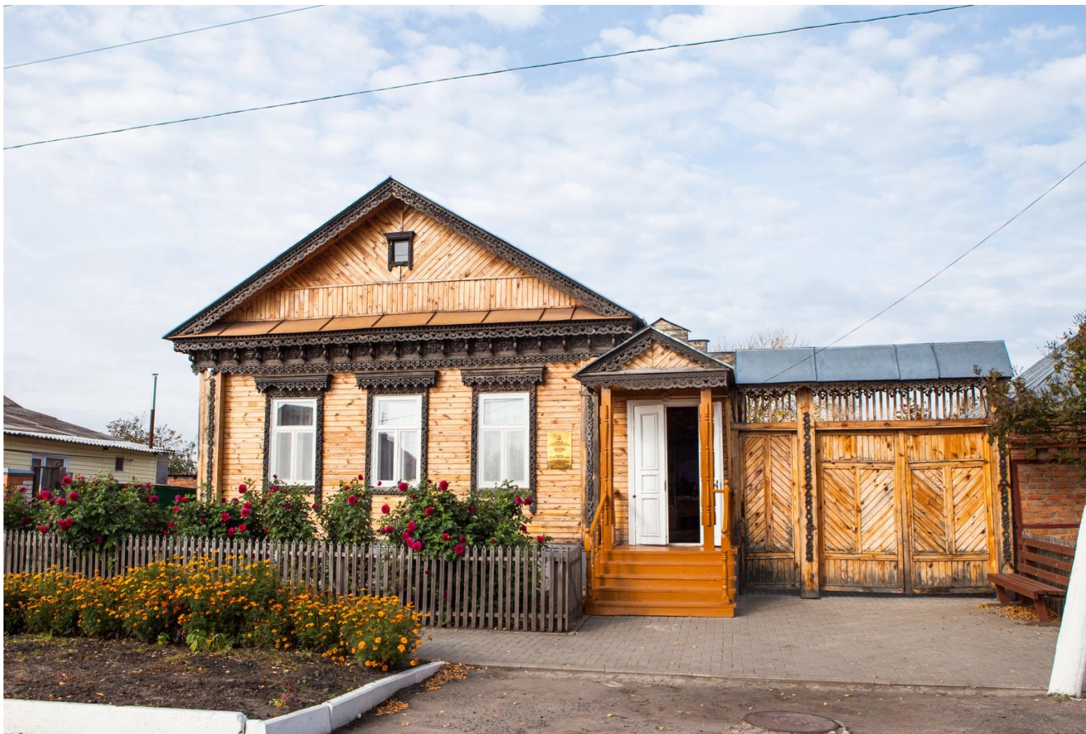
Дом-музей А.И. Куприна