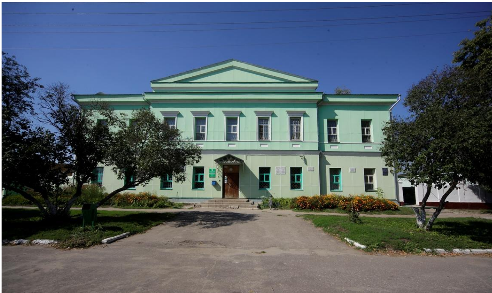
Музей истории и этнографии