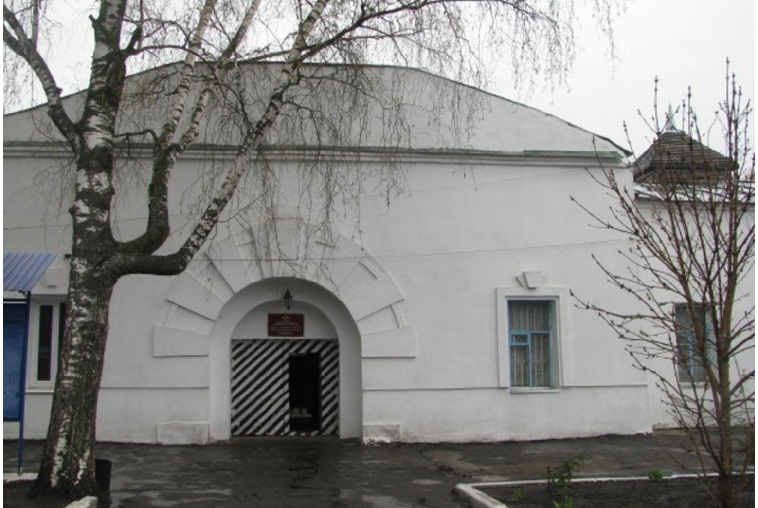
Тюремный комплекс XIX века