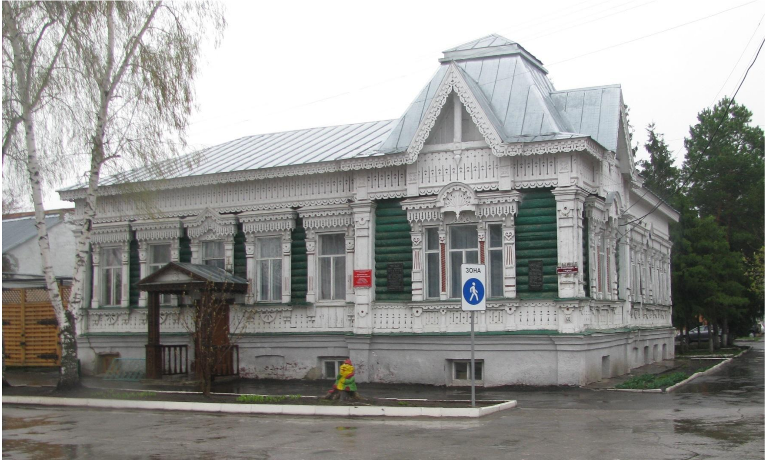
Пушкинский центр им. Н.Н. Пушкиной-Ланской