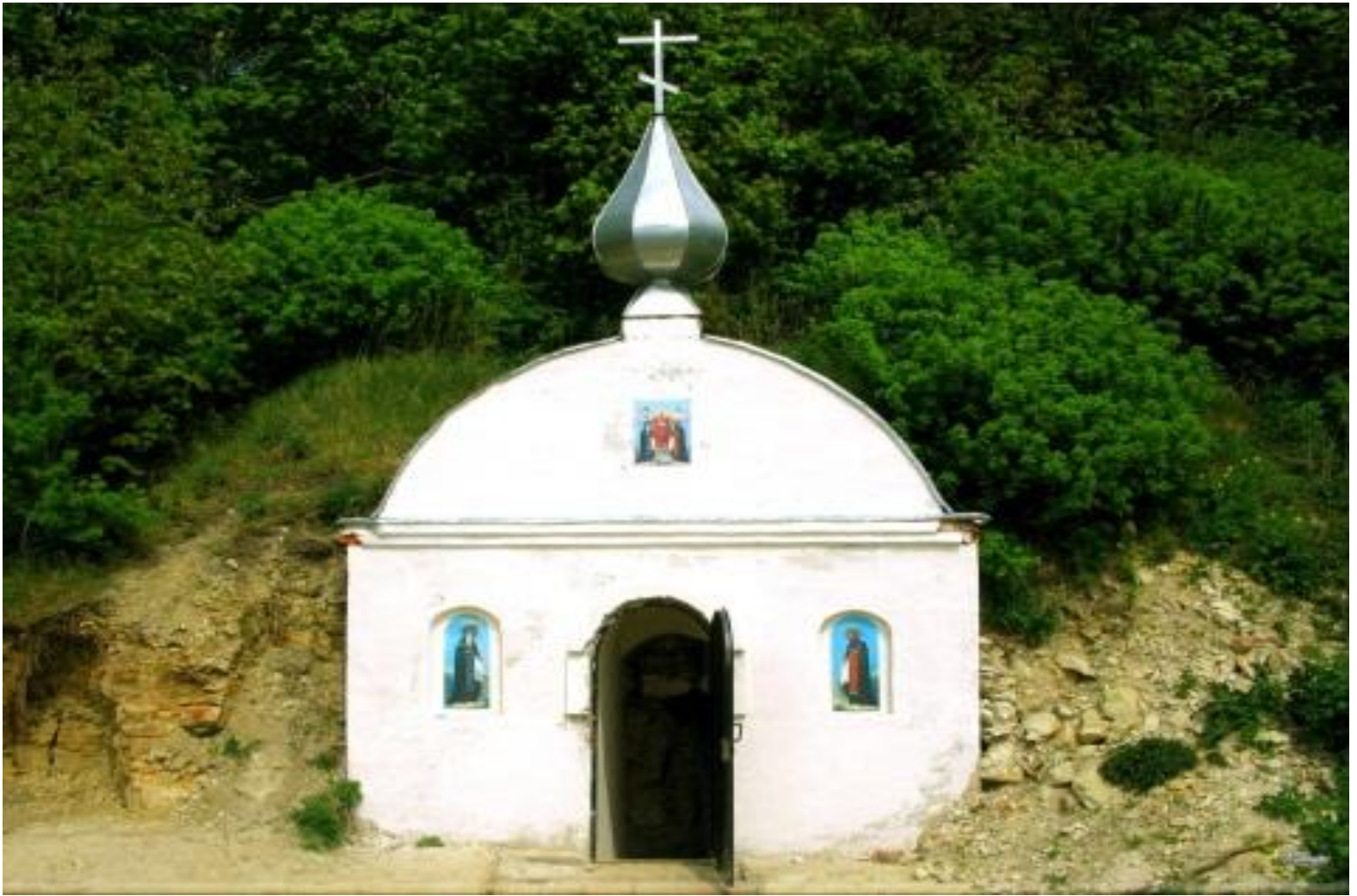
Сканов Пещерный мужской монастырь