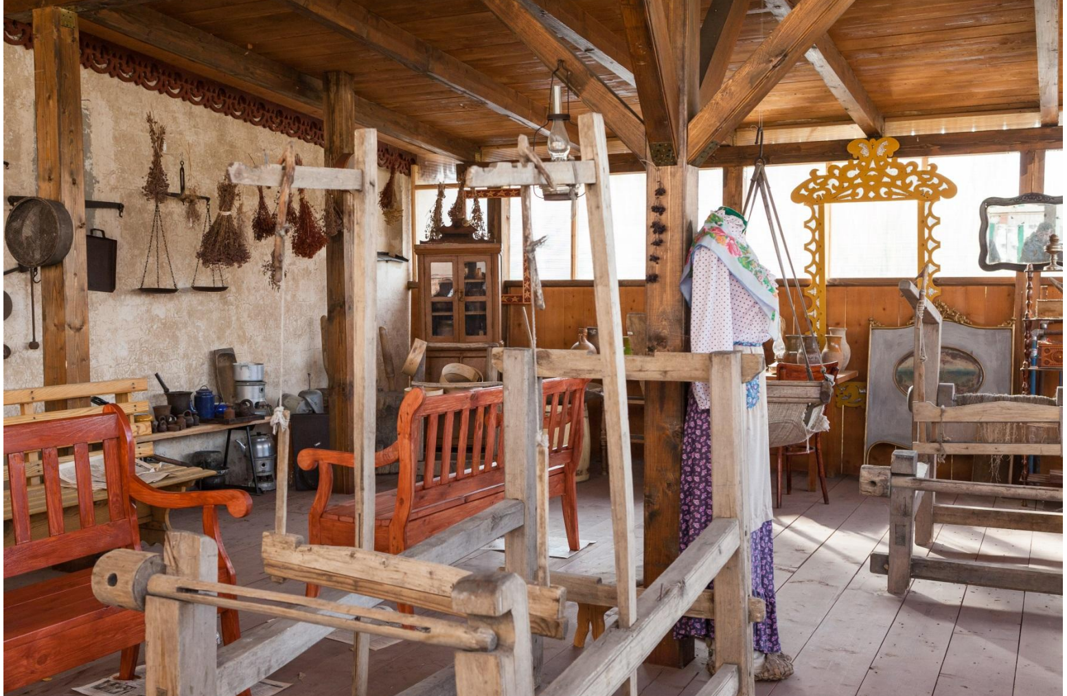
Крестьянское подворье XIX век