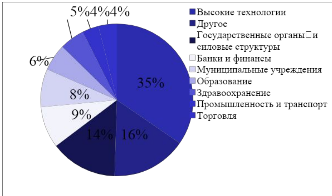
Отраслевое распределение утечек информации за 2021 год