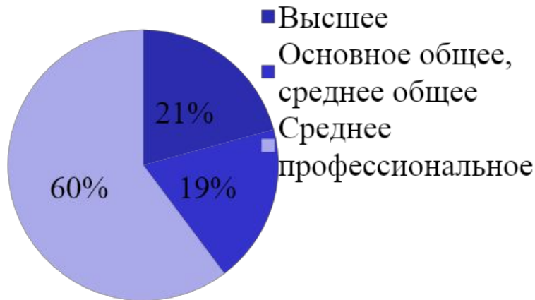
Структура кадрового состава по уровню образования за 2019 год