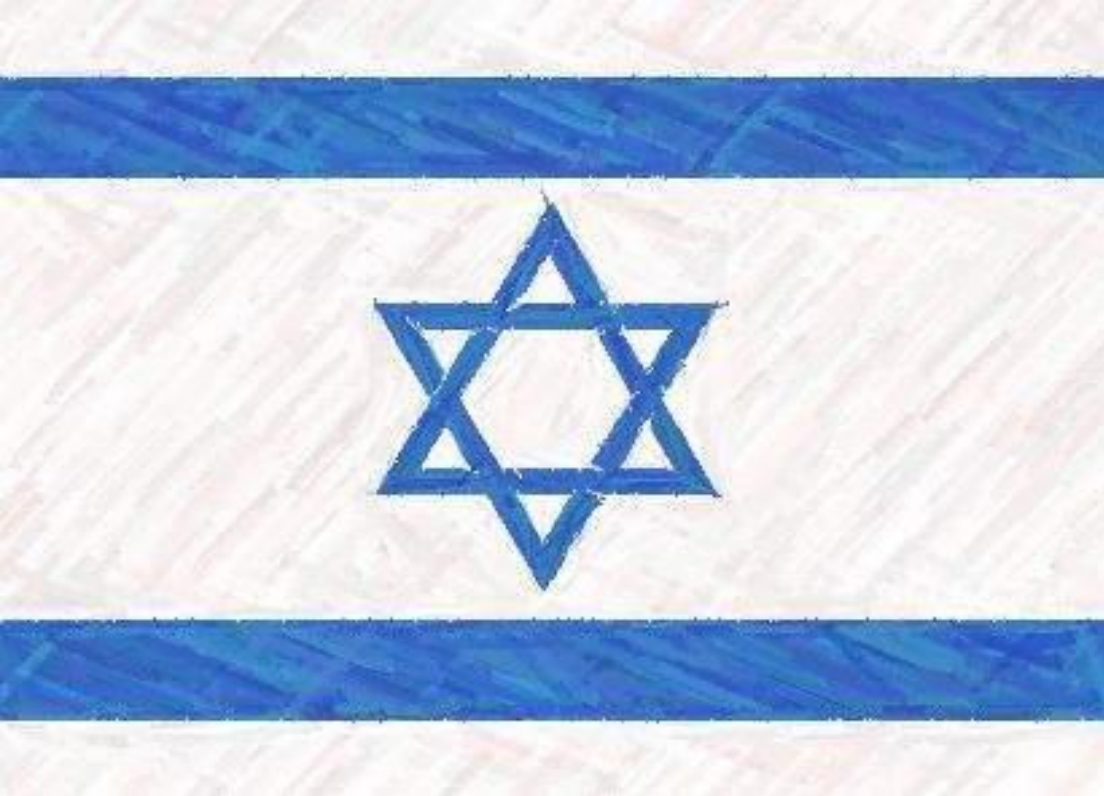
Флаг Государства Израиля