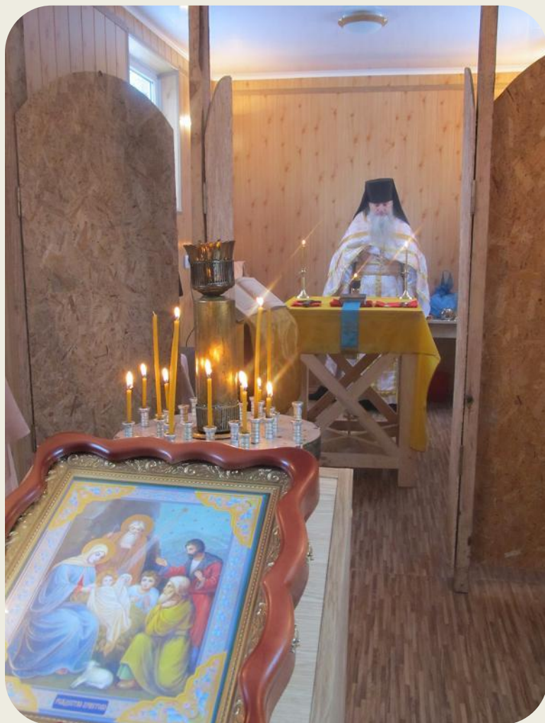
Богослужение во временном храме