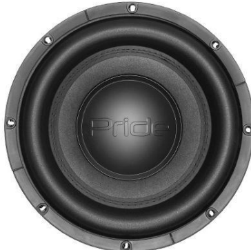
Sapphire 900 W