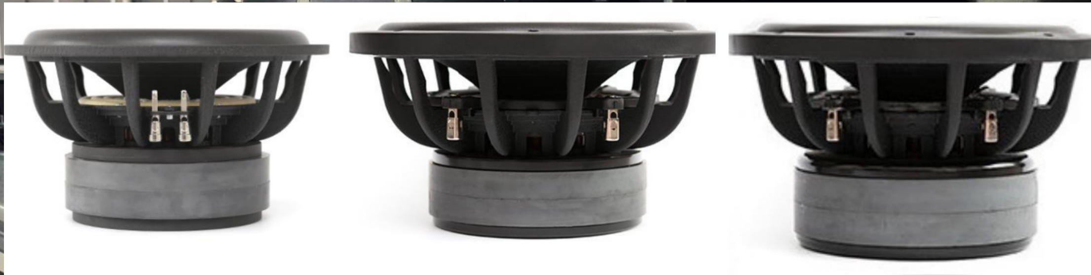
BB v3 1250 W