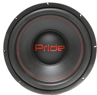
Eco 300 W