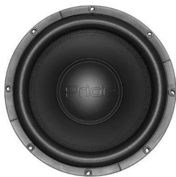
Onyx 600 W