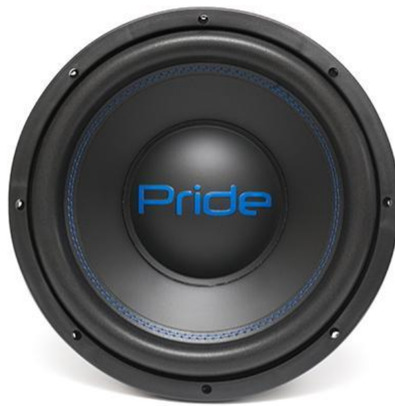
LP 450 W