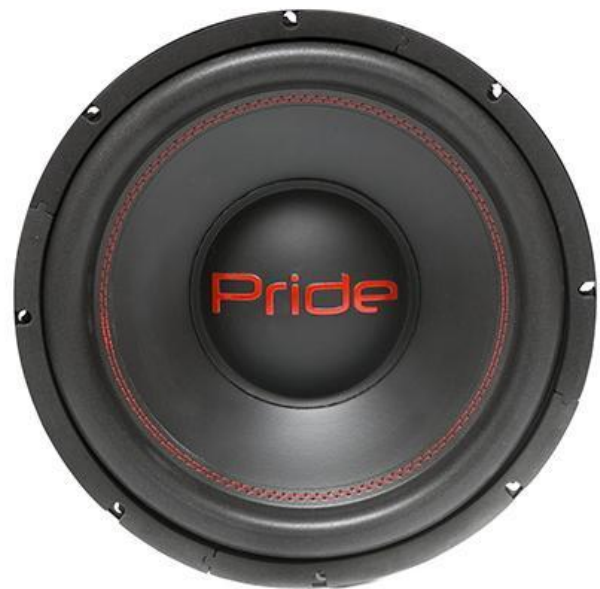
Eco 300 W