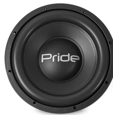
Junior Pro 800 W