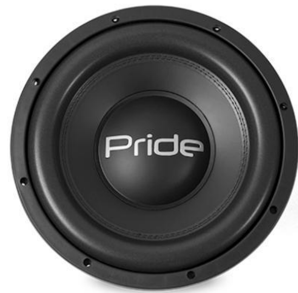
Junior Pro 800 W