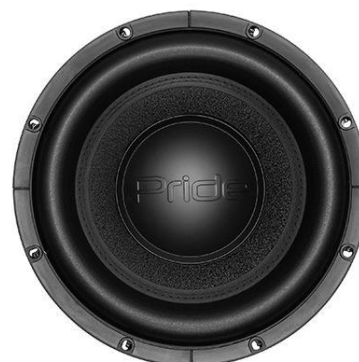
HP Light 1200 W