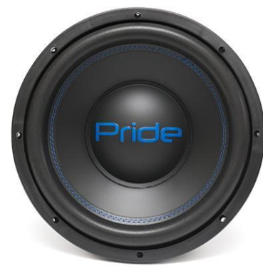
LP 450 W