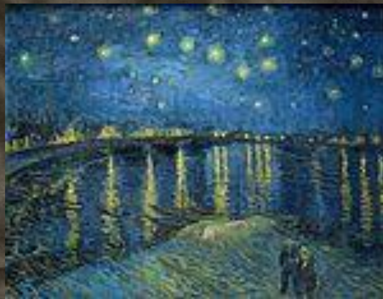
Звездная ночь над Роной