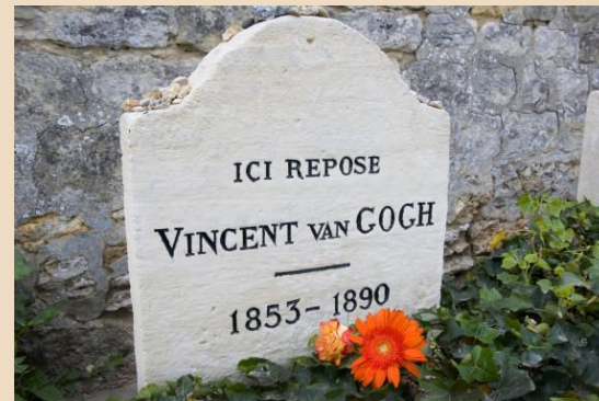
Могила ван Гога

27 липня 1890 Вінсент Ван Гог покінчив життя самогубством, вистріливши собі в груди з пістолета