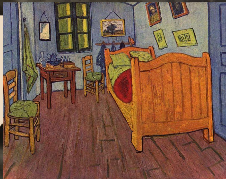
Спальня в Арли