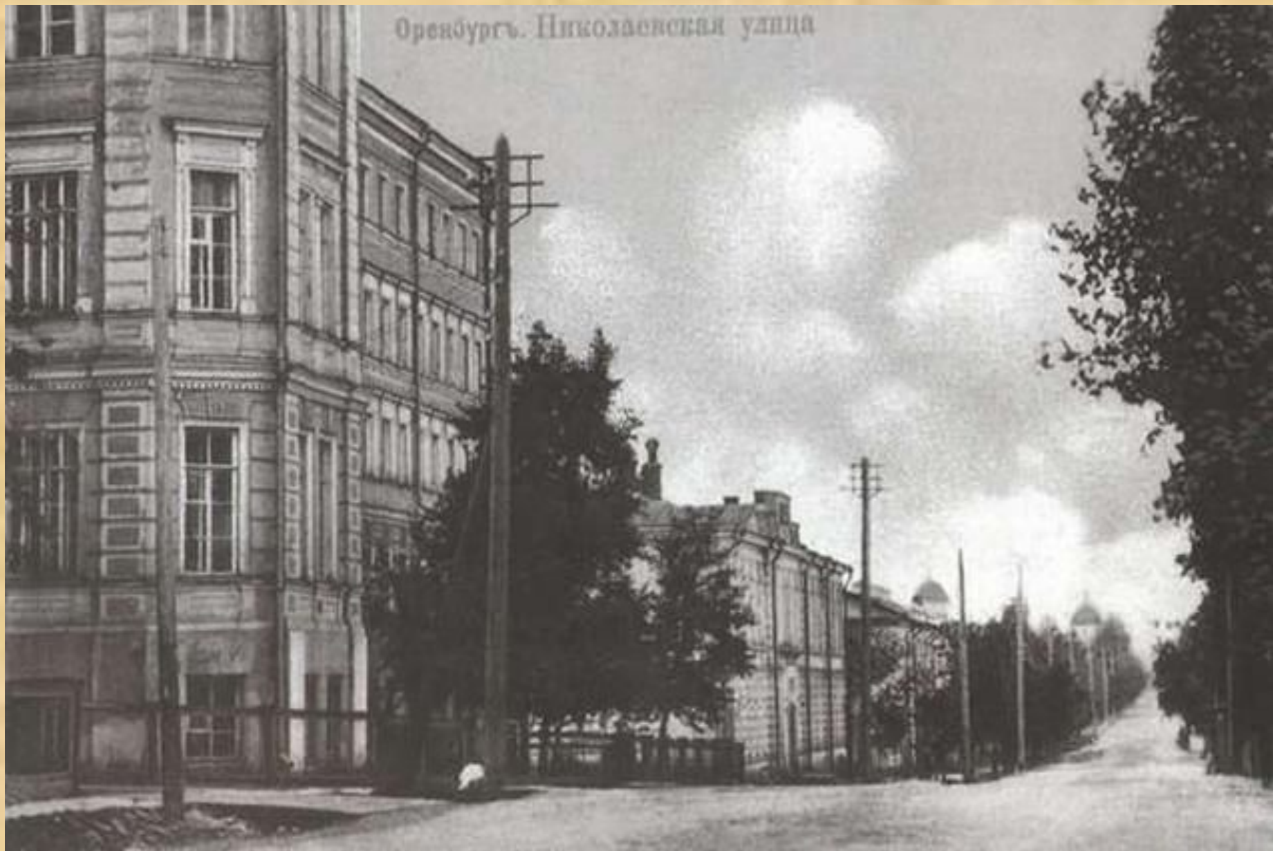
Оренбургъ. Николаевская улица