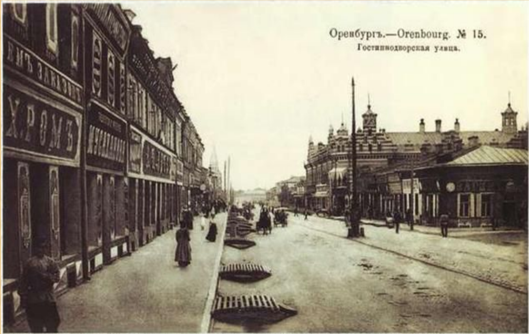
Оренбургъ.—Orenbourg. № 15. Гостиноподворская улица.