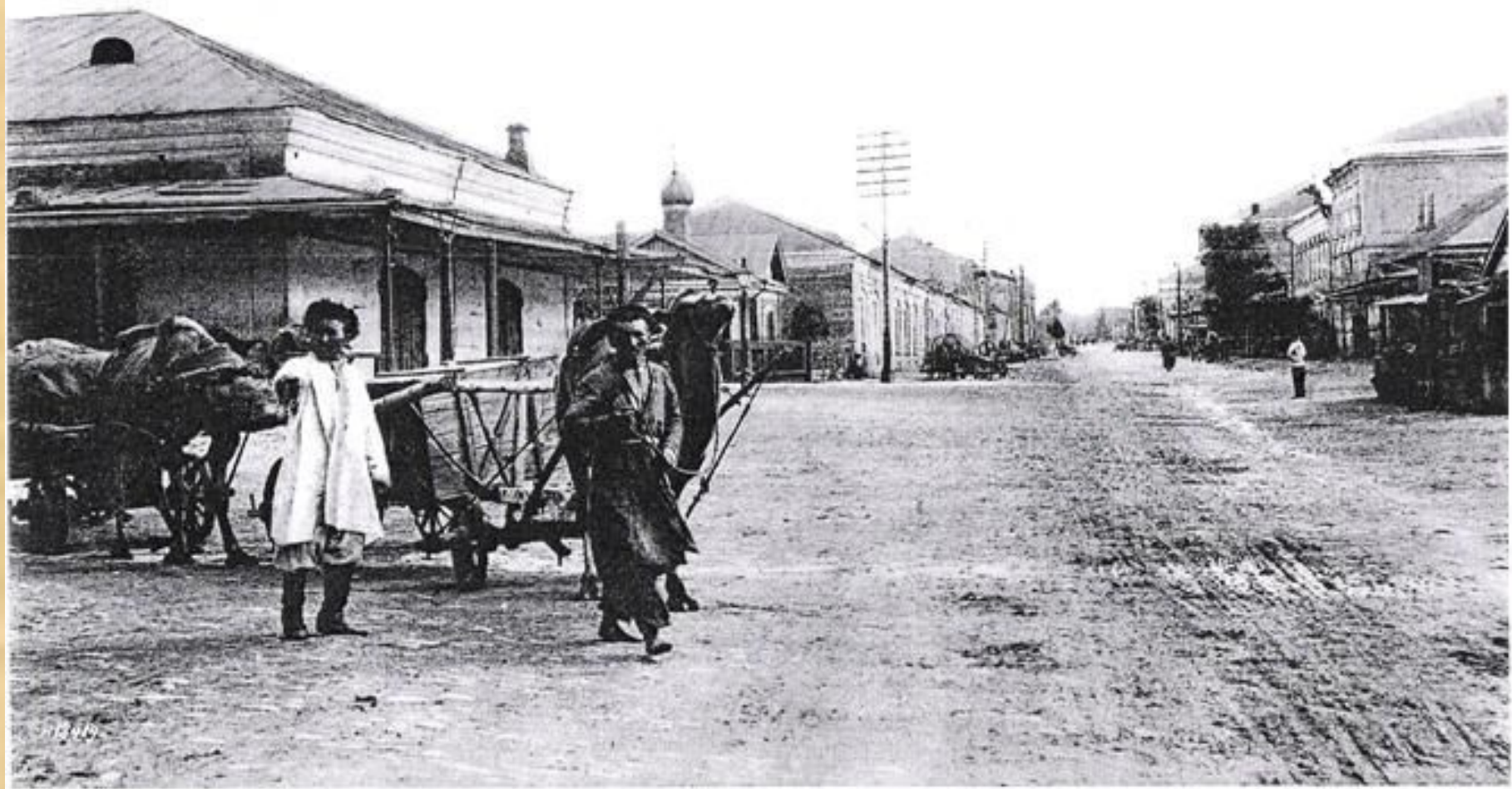
Оренбургъ. Орская улица.