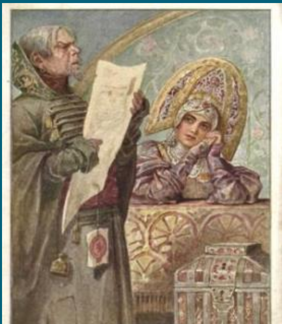
С. Соловьев. Писем