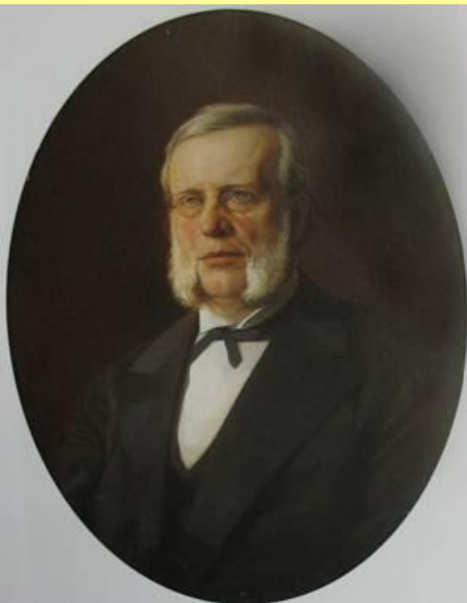
Вышнеградский Иван Алексеевич (1830–1895), министр финансов в 1886–1892 гг.

Ради пополнения казны Вышнеградский поощрял экспорт хлеба: