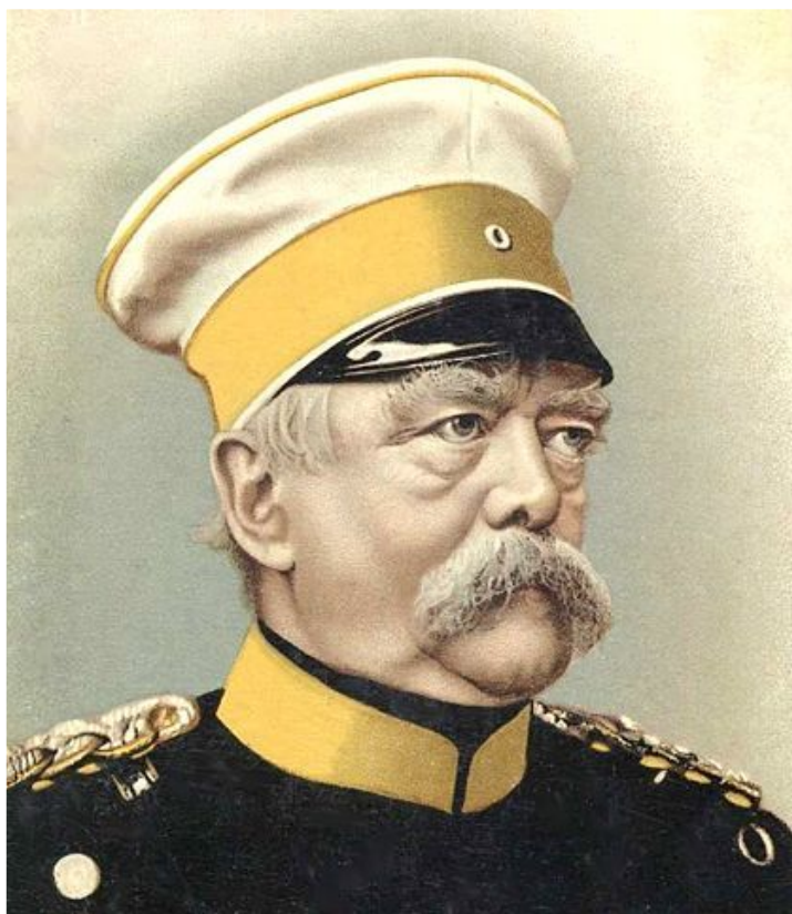
Отто фон Бисмарк