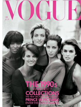
[7] Славный малый, Cover of Vogue