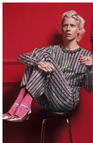
[9] Шут, Gucci