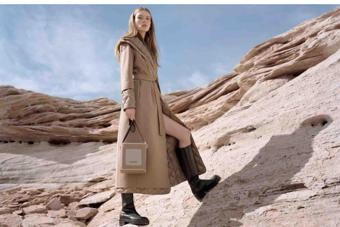
[3] Мудрец, Max Mara