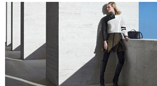
[12] Правитель, Fendi