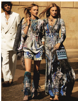
[2] Искатель, Etro