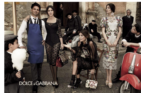
[10] Заботливый, Dolce&Gabbana