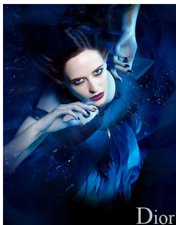
[2] Маг, Dior