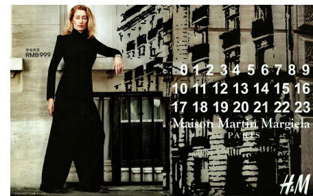
[11] Творец, Maison Martin Margiela for H&M