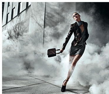
[4] Герой, Hermes