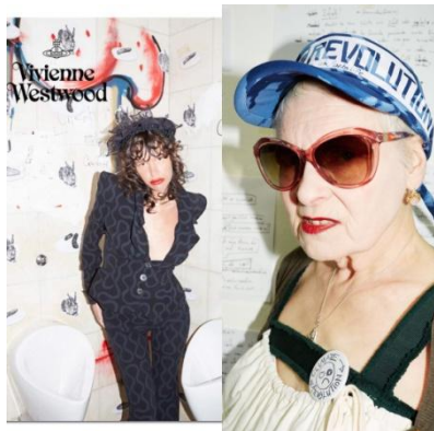
[5] Бунтарь, Vivienne Westwood