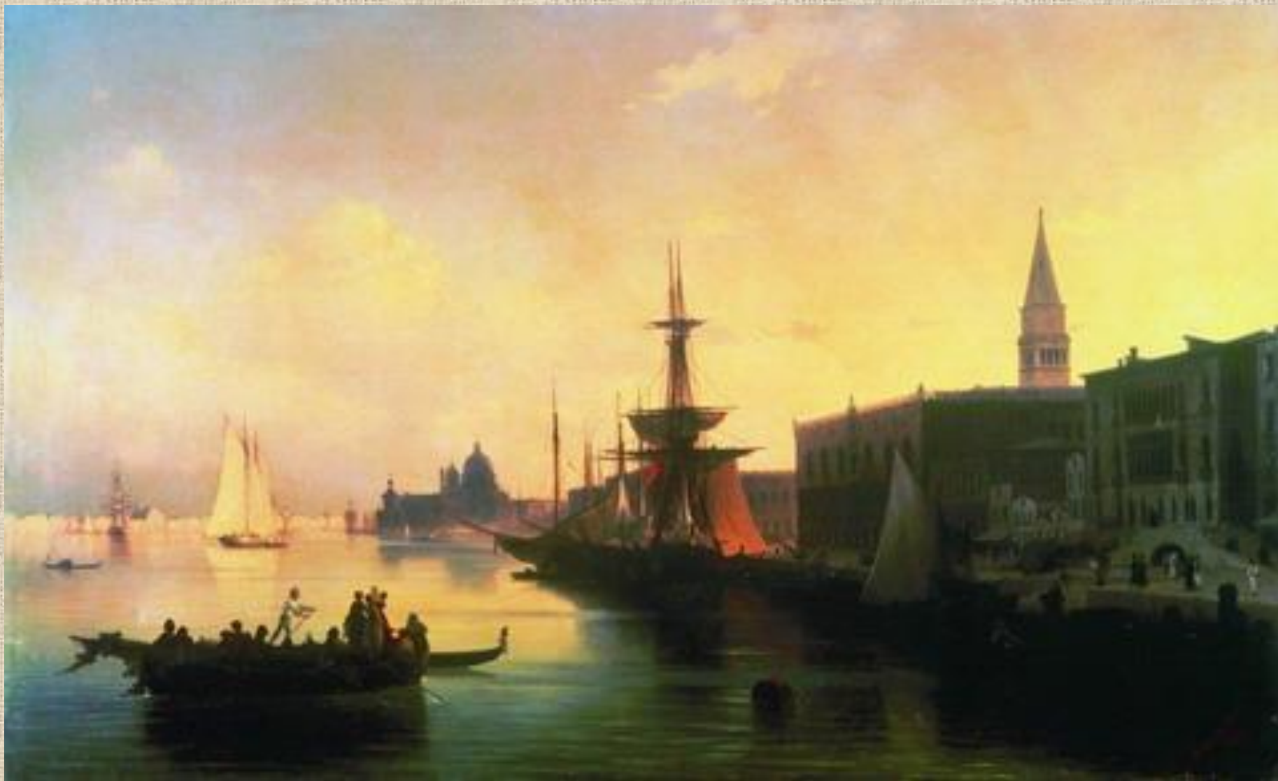
И.К. Айвазовский. Венеция.