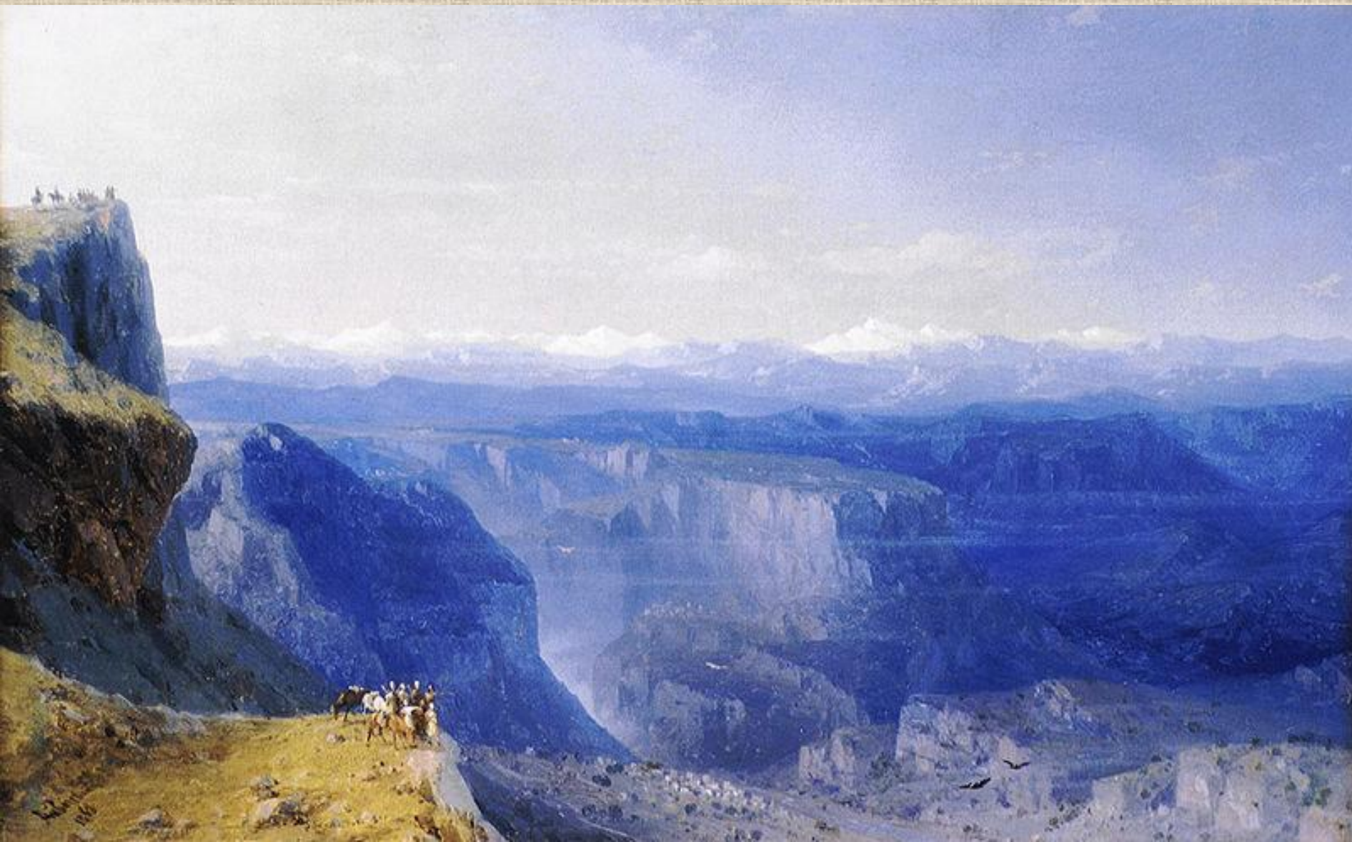
И.К. Айвазовский . Кавказ.