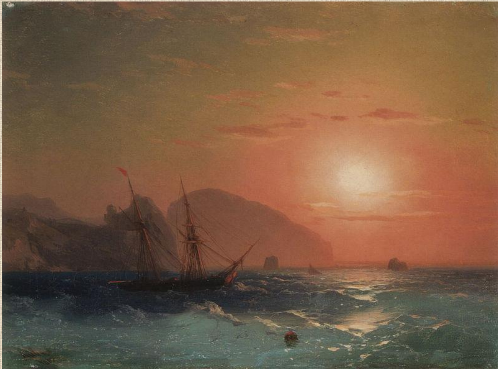
И.К. Айвазовский. Вид на Аю Даг.