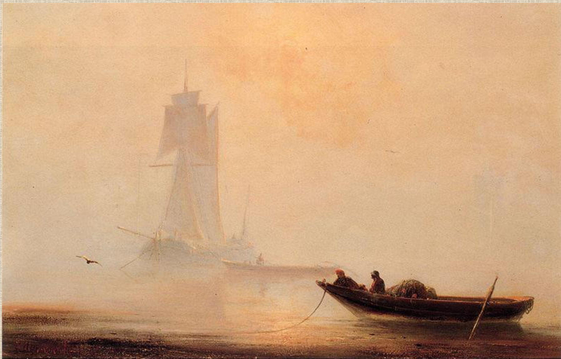
И.К. Айвазовский . Рыболовное судно в гавани