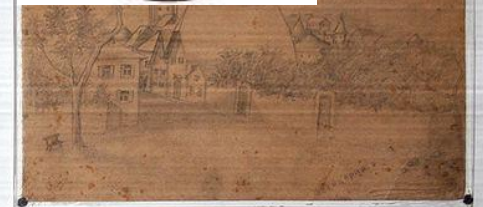
Рисунки Вити Коробкова.