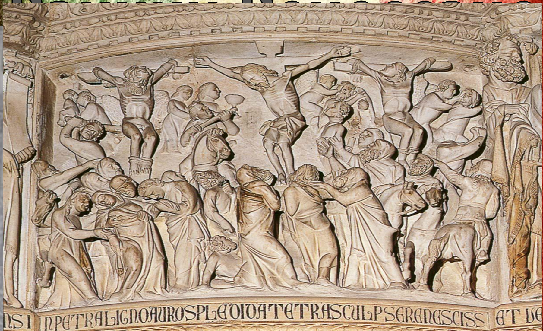
Фрагмент шестигранной мраморной кафедры (1260г.)