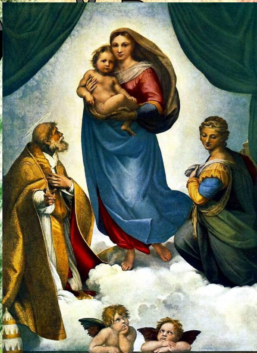
«Сикстинская Мадонна». Рафаэль Санти