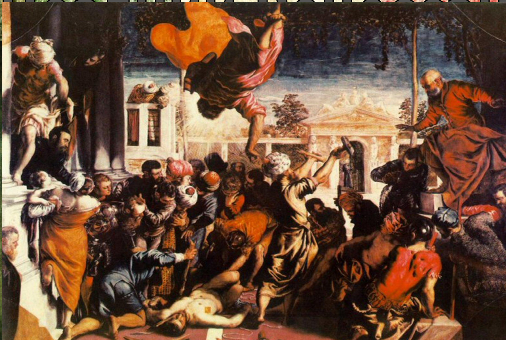
Чудо Святого Марка. (1548 г.) Тинторетто.