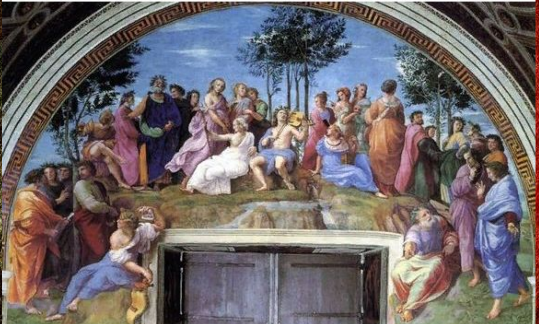
Фреска. «Парнас». Рафаэль Санти.