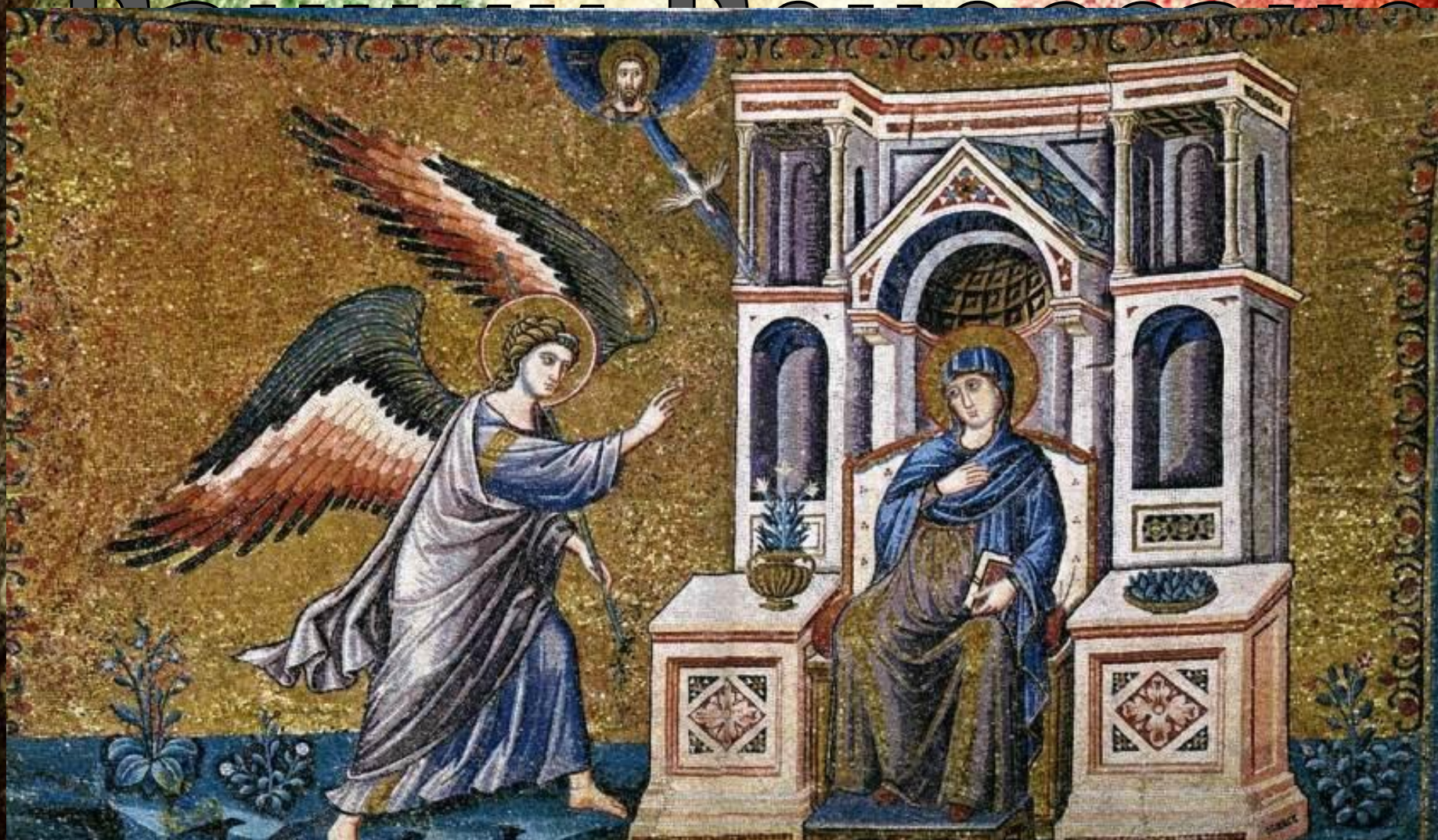
Мозаика. Церковь Санта – Мария ин Трастевере. Рим. (1291 г.)