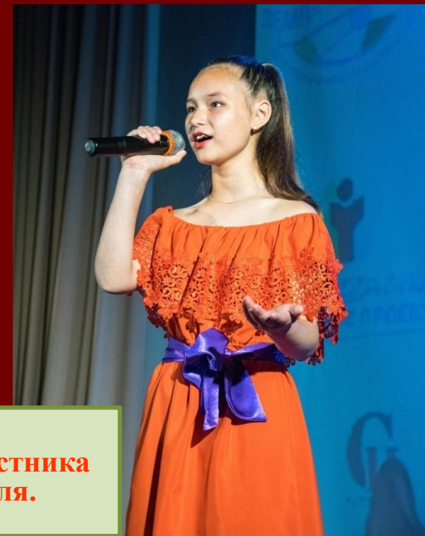
Диплом участника фестиваля.