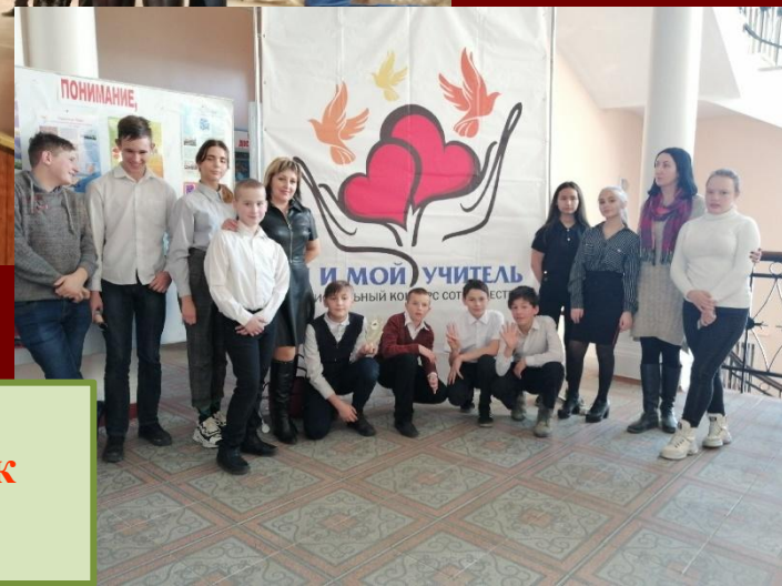
Диплом III степени, благодарность, кубок