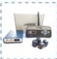
Система контроля давления в шинах