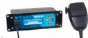
Речевые информаторы "Искра-02"