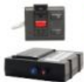
Система экстренного реагирования «ЭРА ГЛОНАСС»