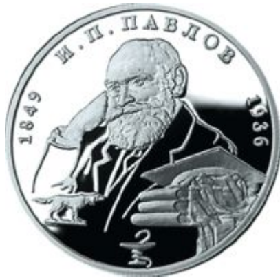
Серебряная памятная монета Банка России, посвящённая 150- летию со дня рождения И. П. Павлова, 1999 г.

1890 — избран профессором и заведующим кафедрой фармакологии ВМА, а в 1896 — заведующим кафедрой физиологии, которой руководил до 1924. Одновременно (с 1890) Павлов — заведующий физиологической лабораторией при организованном тогда институте экспериментальной медицины.