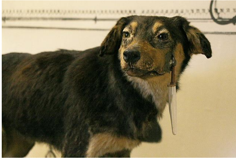
Собака Павлова, Музей Павлова, 2005