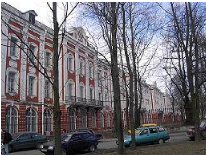
Главный фасад здания Двенадцати коллегий, выходящий на Менделеевскую линию. Современный вид

В 1870 поступил на юридический факультет (семинаристы были ограничены в выборе университетских специальностей), но через 17 дней после поступления перешёл на естественное отделение физико-математического факультета Петербургского университета (специализировался по физиологии)