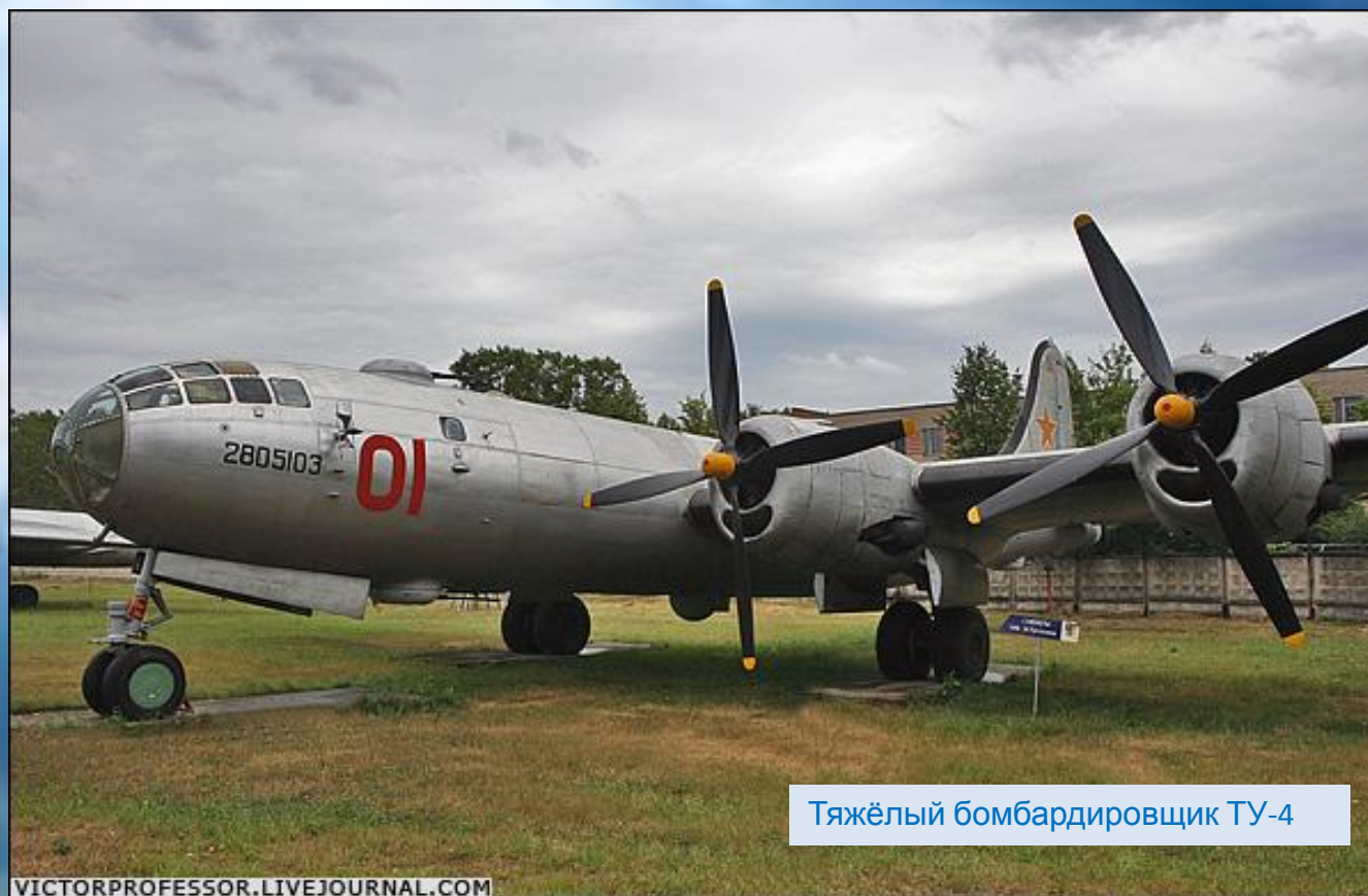
Тяжёлый бомбардировщик ТУ-4

В 1950 году успешно сдал вступительные экзамены по программе 10-летнего образования поступил в Балашовское военное училище лётчиков – бомбардировщиков. В 1952 году успешно окончил его и получил назначение в г. Быков Могилёвской области, правым лётчиком на тяжёлый бомбардировщик ТУ-4.