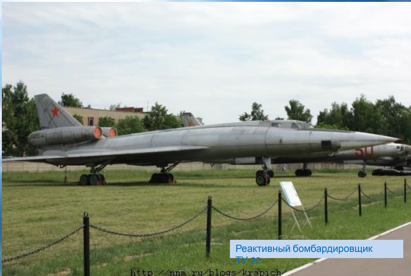
Реактивный бомбардировщик ТУ-22

В 1963 году был назначен командиром авиационного отряда. В этом же году по семейным обстоятельствам переехал в г. Шайковку Брянской области, где пробыл несколько месяцев. В этом же году переучился на новый реактивный бомбардировщик ТУ -22 и направлен командиром отряда в г. Зябровка Гомельского района, где служил лётчиком инструктором.