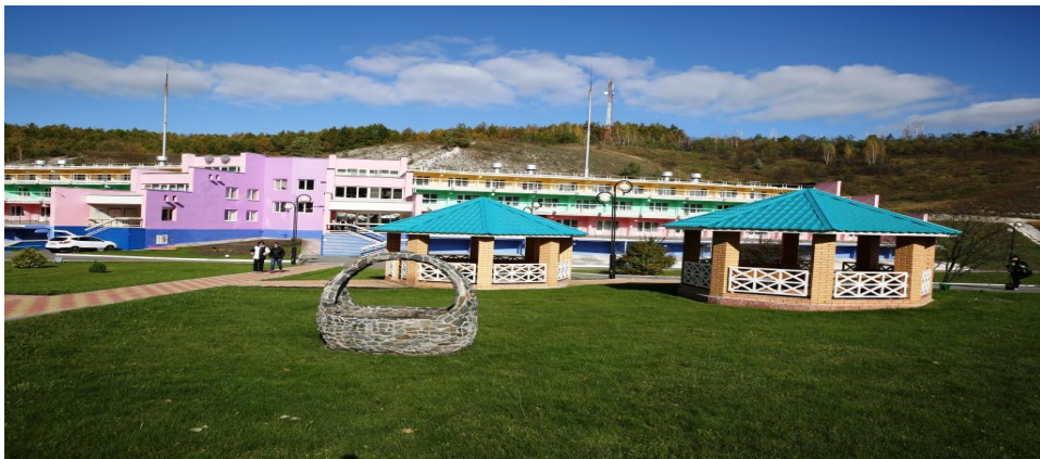
База отдыха «Металлург»