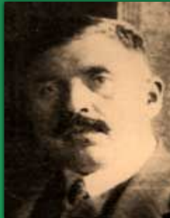
Шандор Гурбаї - угорський політик-соціаліст.

Нова влада копіювала не лише назву держави своїх московських покровителів, але й їхні методи правління: замість поліції було утворено «Червону міліцію», утворювалась Червона Армія. Почались репресії проти незадоволених, застосовувався терор. Усе це загостило ситуацію в країні й сприяло створенню антирадянського фронту.