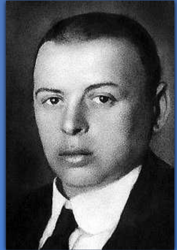
Бела Кун – угорський політик-комуніст та більшовицький революціонер.

Угорські події були розцінені російськими більшовиками як один із проявів «всесвітньої комуністичної революції». Утворена в листопаді 1918 р. з інструктованих у Москві військовополонених Угорська комуністична партія на чолі Бела Куном стала готуватися до захоплення влади.