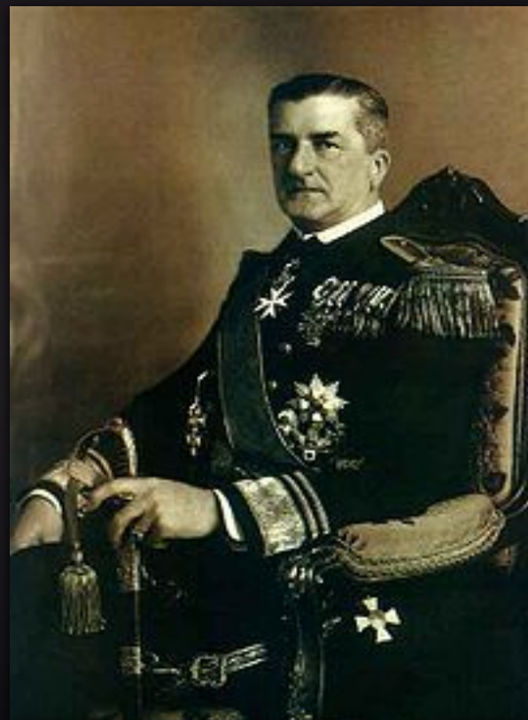
Міклош Хорті — регент Королівства Угорщина (1920—1944), контр-адмірал австро-угорського флоту (1918).

Після падіння комуністичного режиму правителем Угорщини було проголошено ерцгерцога Габсбургського, який доручив сформувати уряд С. Фрідріху. Але Антанта не визнала його й віддала перевагу М. Хорті . Обраний у січні 1920 р. парламент ліквідував республіканський устрій і обрав М. Хорті регентом. Двічі впродовж 1921 р. імператор Карл Габсбург робив спроби повернути собі угорську корону, але заперечення Антанти зробили його зусилля марними.