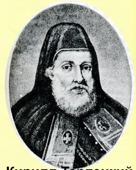
Кирилл Терлецкий Епископ луцкий

http://szlachta.io.ua/v1f8b0439f94734d223eb02eb8d78b95c