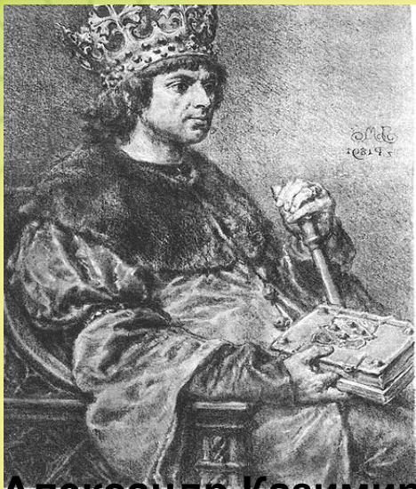
Александр Казимирович Великий литовский князь