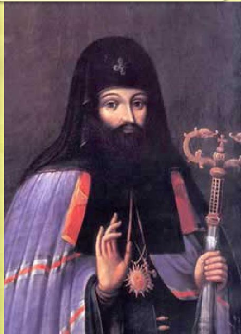
Киевский митрополит Пётр Могила