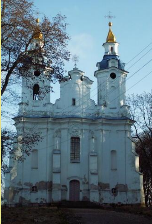
Униатская церковь, Вольно, Барановичи