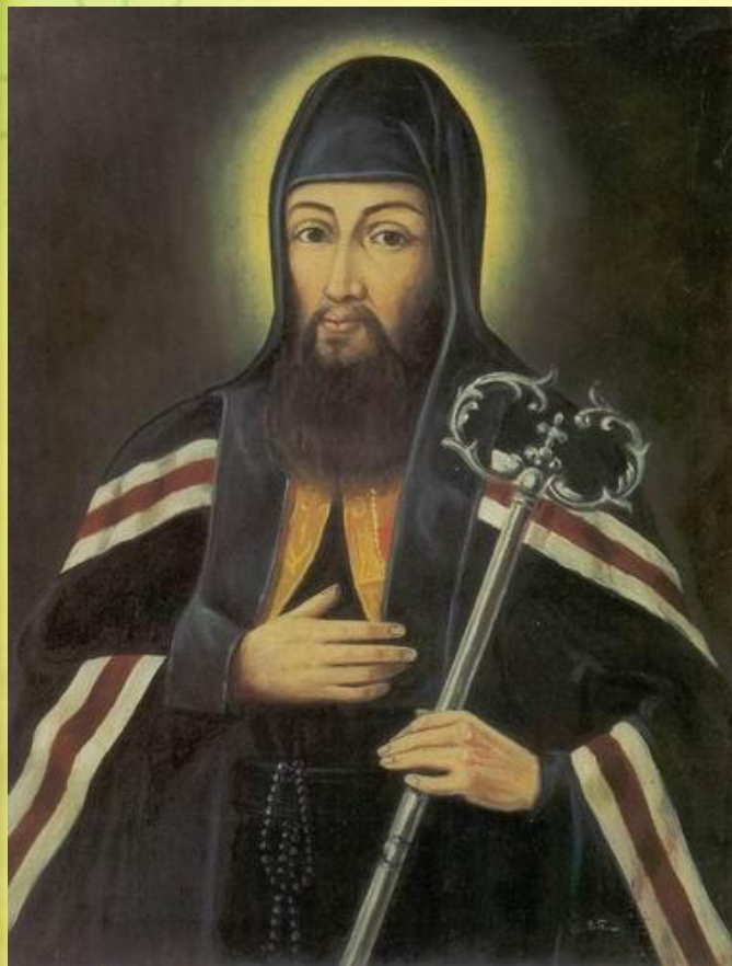
Архиепископ Иосафат Кунцевич