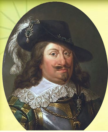
Владислав IV Ваза