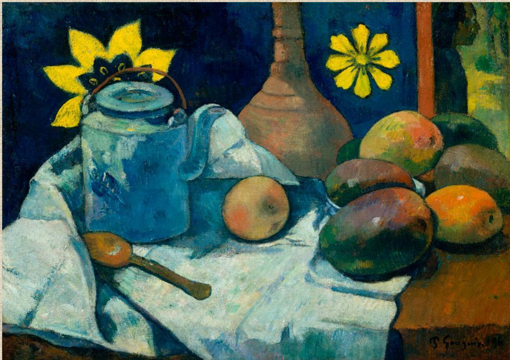
П. Гоген, «Натюрморт с Чайником и фруктами», 1896г.