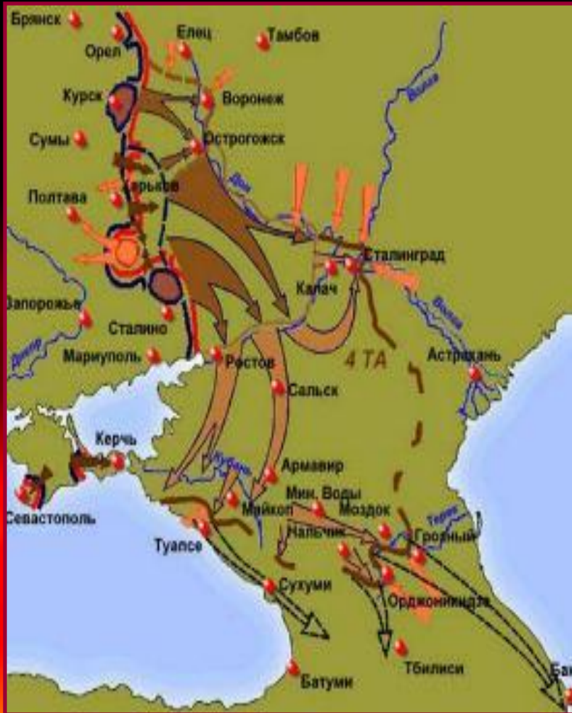
Немецкое наступление летом 1942 г.

Весной 1942 г. немцы начали наступление в Крыму и наконец смогли овладеть Севастополем и Керченским полуостровом.