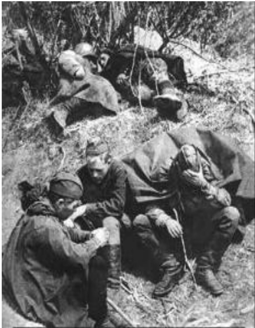
Воронежский фронт. Между боями.

Немцы вышли к Дону 24 июля заняли Ростов-на-Дону. Сталин, чтобы спасти ситуацию, подписывает приказ №227 (« Ни шагу назад! »).