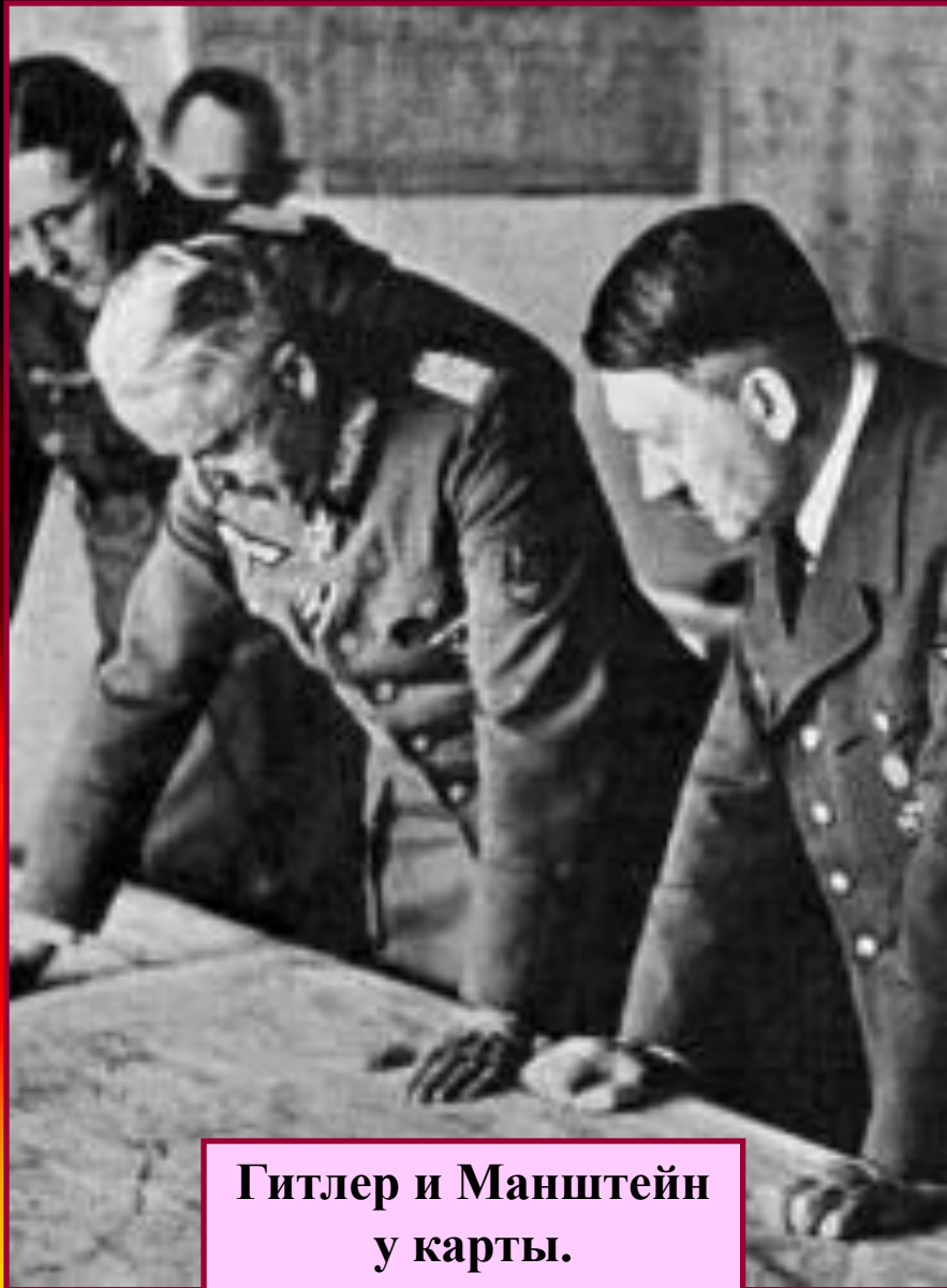
Гитлер и Манштейн у карты.

В 1942г. планировалось начать общее наступление, т.к. руководство было уверено, что немцы весной –летом 1942 г.вновь начнут наступление на Москву