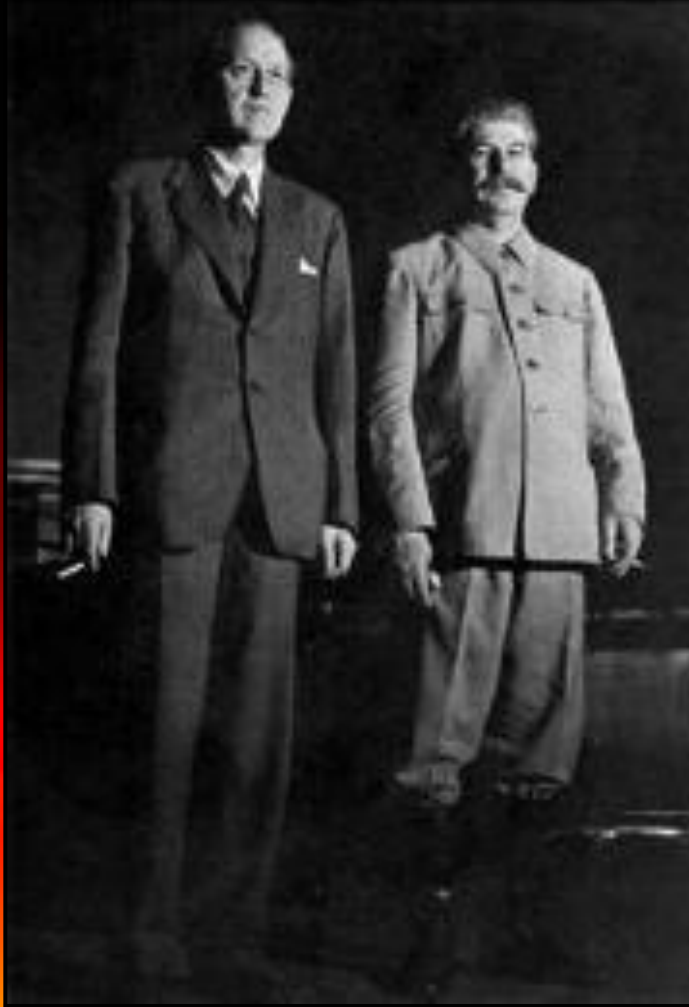
Сталин и Г.Хопкинс на переговорах по ленд-лизу

Летом 1941 г. Англия и США заявили о своей поддержке Советского Союза. В июле 1941 г. СССР и Великобритания подписали соглашение совместных действиях, а в августе США объявили об Оказании нашей стране экономической и военно-технической помощи. В сентябре к этому соглашению присоединилась Англия. После нападения на Перл-Харбор японцев, США наконец-то вступили в войну.