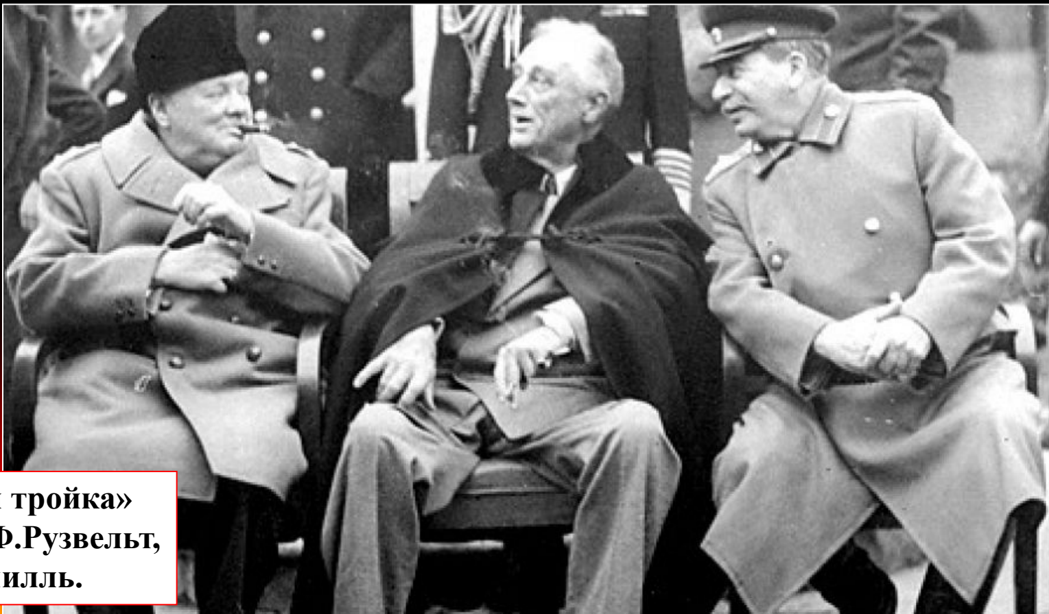
«Большая тройка» И.Сталин, Ф.Рузвельт, У.Черчилль.

1 января 1942г. была образована антигитлеровская коалиция из 26 государств. Члены коалиции обязались все свои ресурсы направить на борьбу с агрессором и не заключать сепаратного мира.