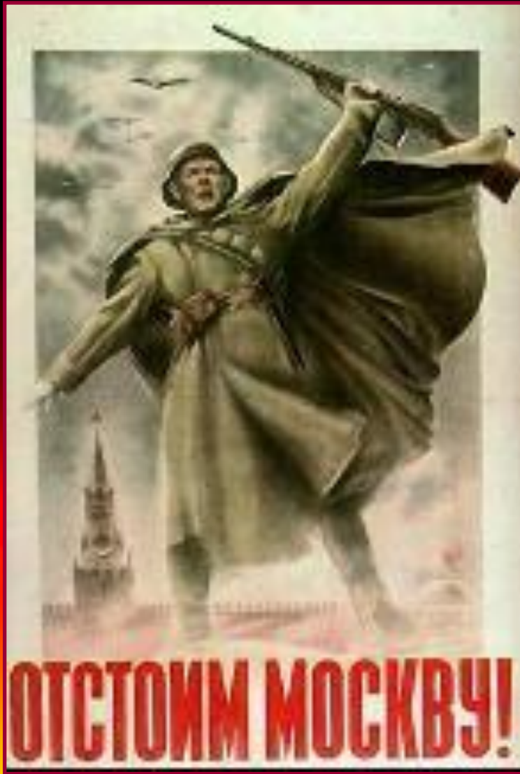
Плакат 1941 г.

Для захвата Москвы был подготовлен план «Тайфун». Немцы попытались достичь на этом на правлении 3-кратного превосходству в живой силе и технике.