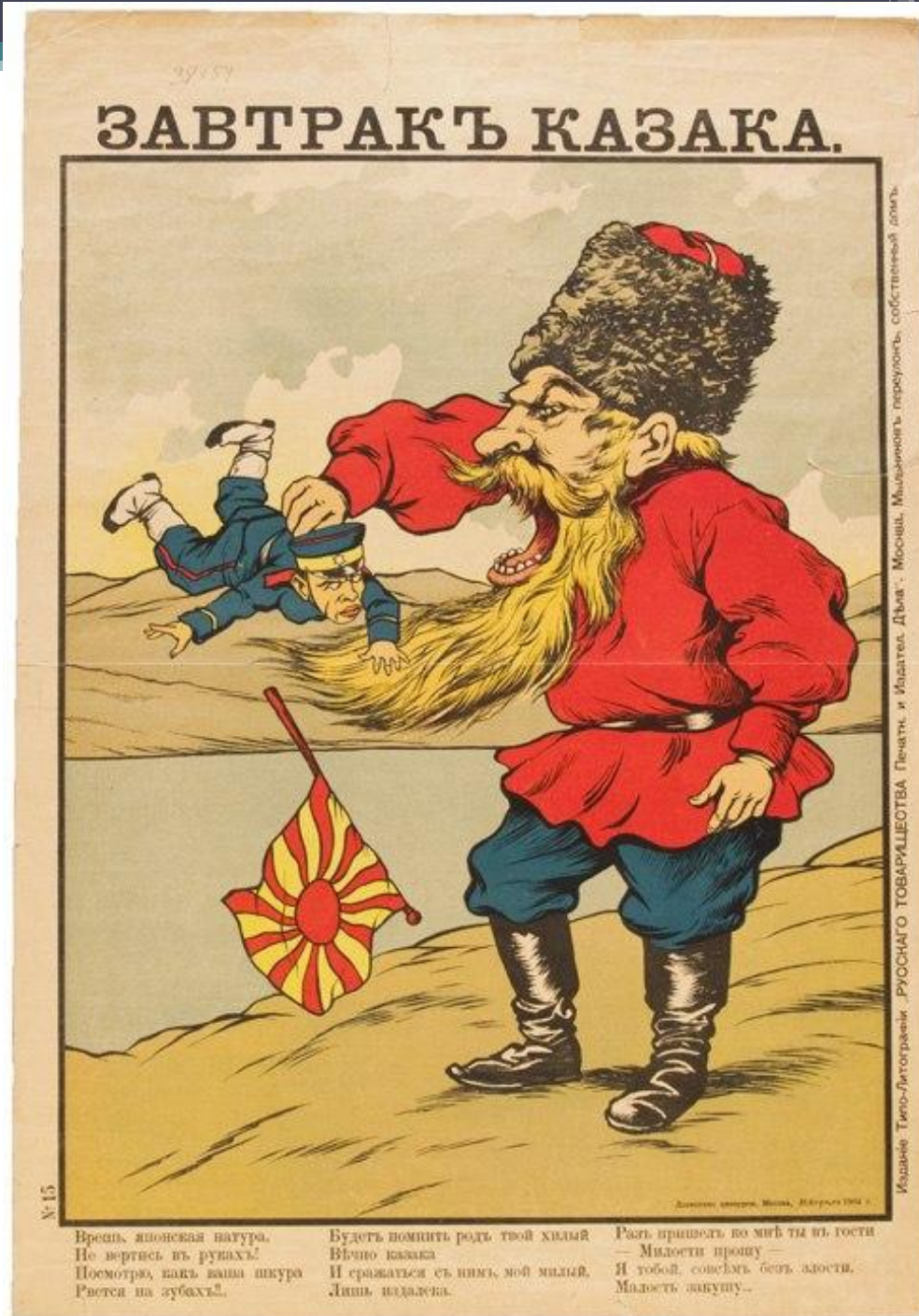
Завтрак казака. Плакат времён русско-японской войны.