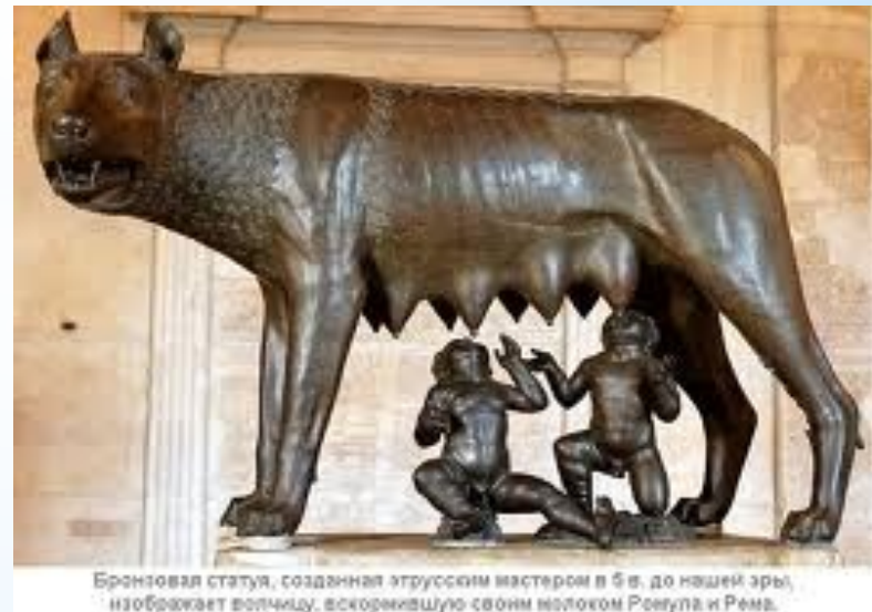
Бронзовая статуя, созданная этрусским мастером в 5 в. до нашей эры, изображает волчицу, вскормившую своим молоком Ромула и Рея.