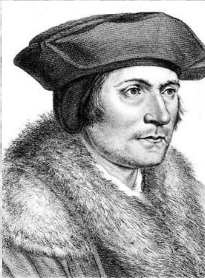
Томас Мор (1478–1535)