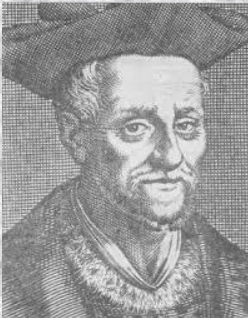
Франсуа Рабле (1494–1553)