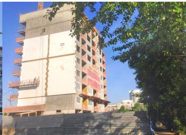
Август 2016 г.