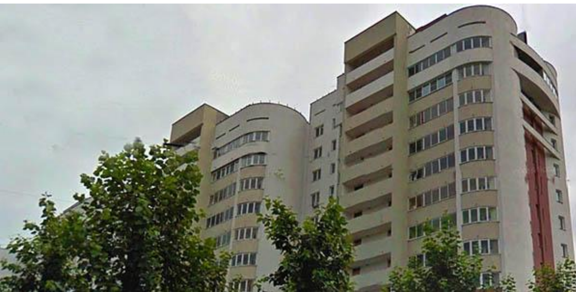
Жилой дом, г.Екатеринбург, пр. Космонавтов, 32

118 обманутых дольщика обрели новое жильё.