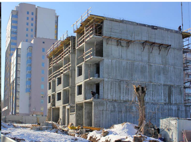
Март 2016 г.