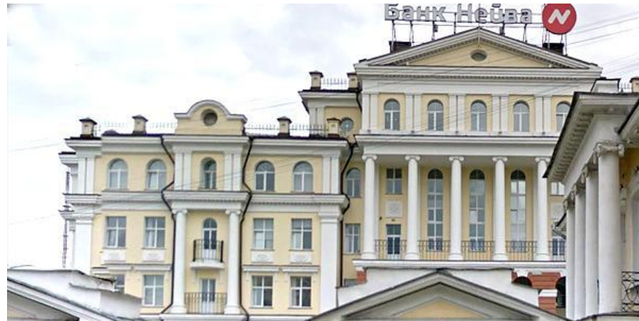
Офисное здание банка «Нейва», г.Екатеринбург, ул.Чапаева, 3а