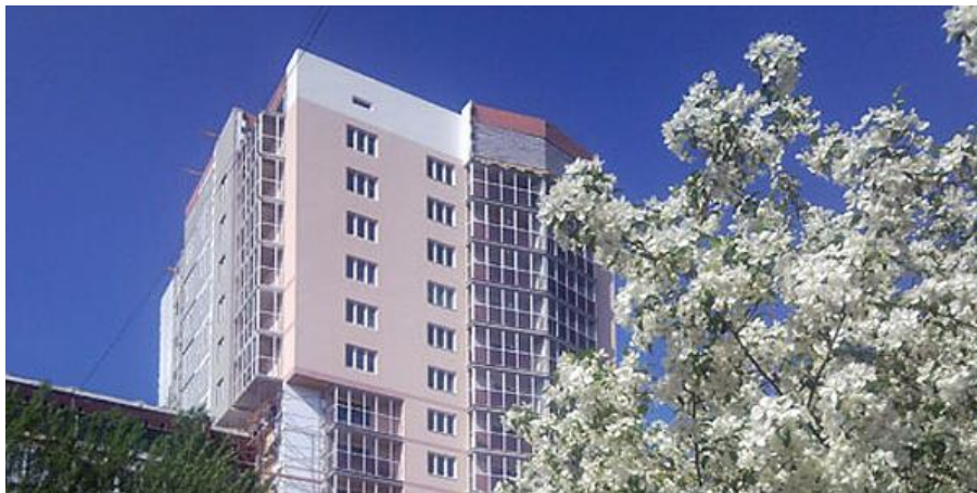
Жилой дом, г.Екатеринбург, ул.Таганская, 53а