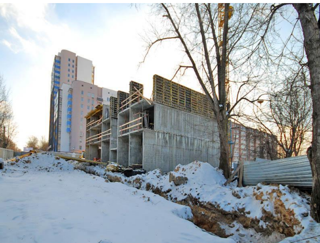
Декабрь 2015 г.

В декабре 2015 года началось строительство девятиэтажной секции, сдача которой запланирована на IV квартал 2016 года.