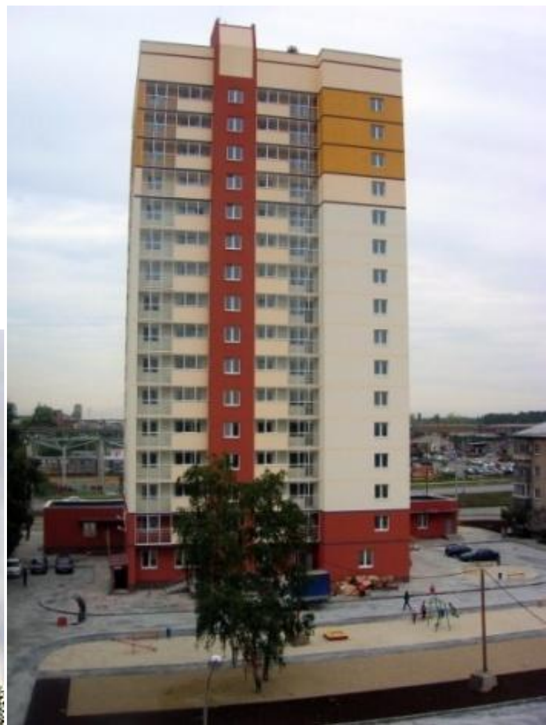
Жилой дом, г.Екатеринбург, ул. Сыромолотова, 34