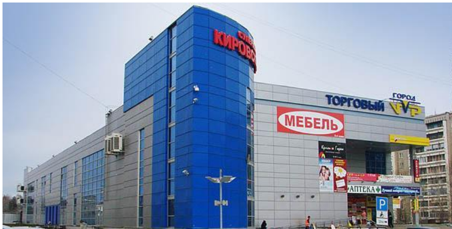
Торговый центр «Город VIP», г.Верхняя Пышма, Успенский проспект, 127