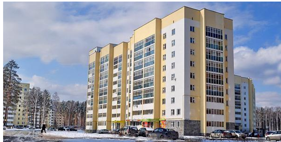
Жилой дом, г.Верхняя Пышма, ул. Уральских рабочих 42