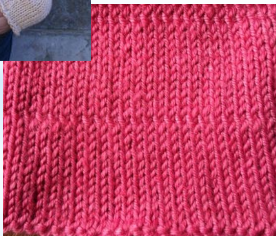
* Модель №2