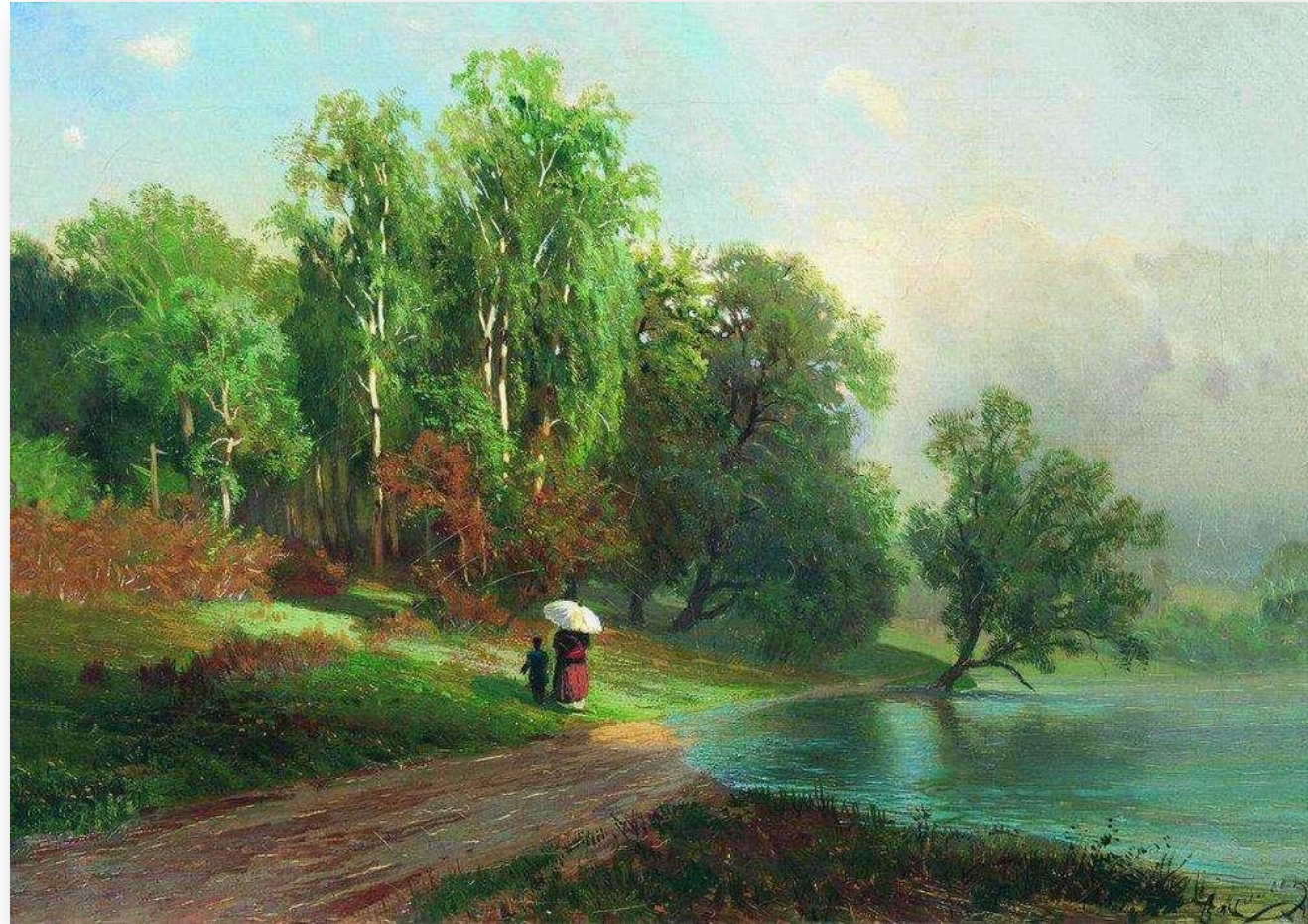
Ф.Васильев. Лето. Речка в Красном селе. 1870

Композиция, построенная по законам искусства, придает произведению целостность и гармоничность