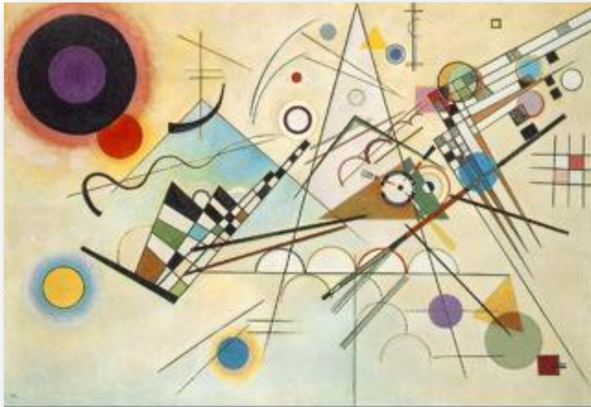
В.Кандинский. Композиция VIII

С помощью геометрических фигур, линий, цветowych пятен создать композицию на тему « Мой день »