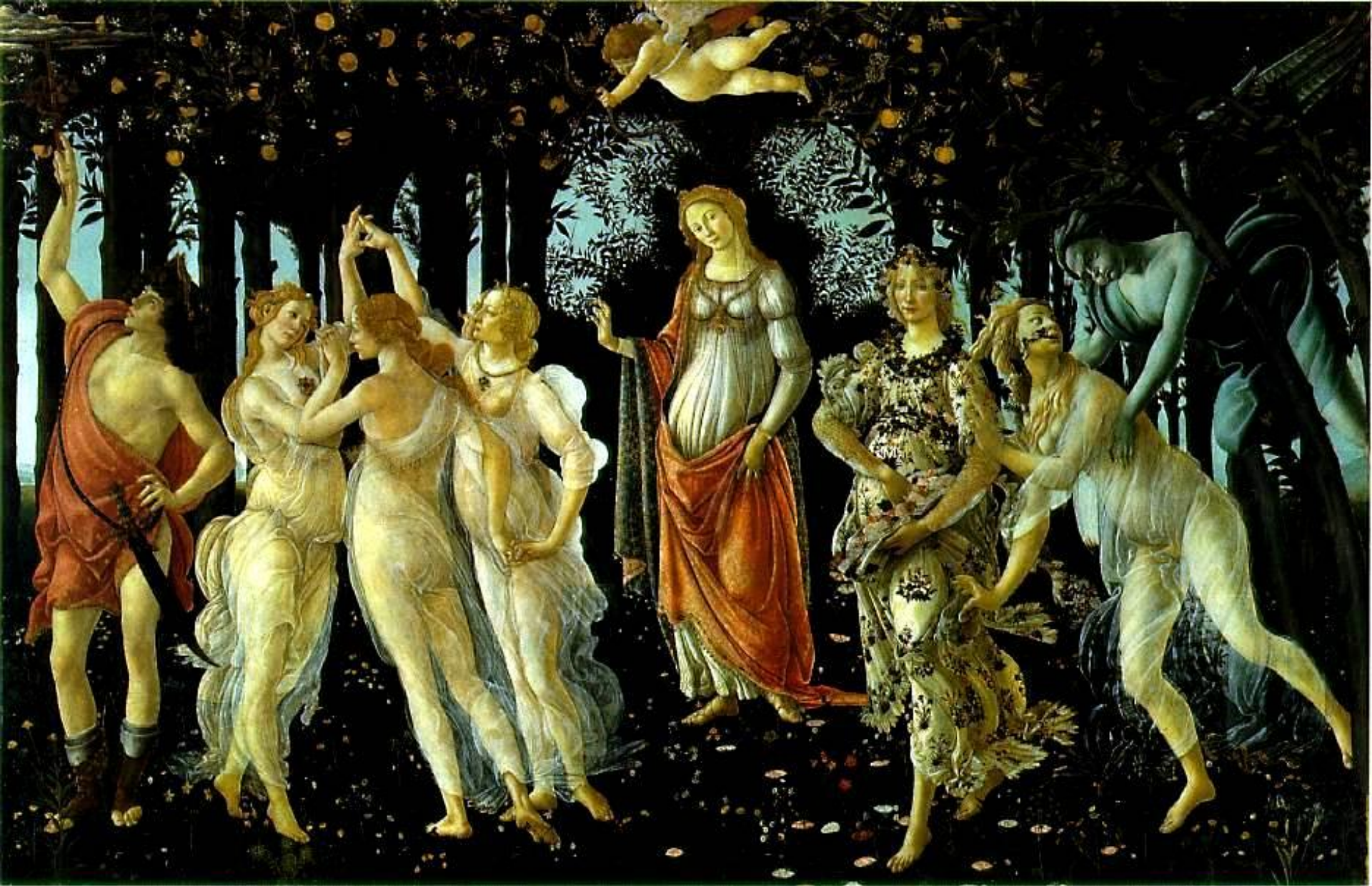
Сандро Боттичелли. Весна. 1477