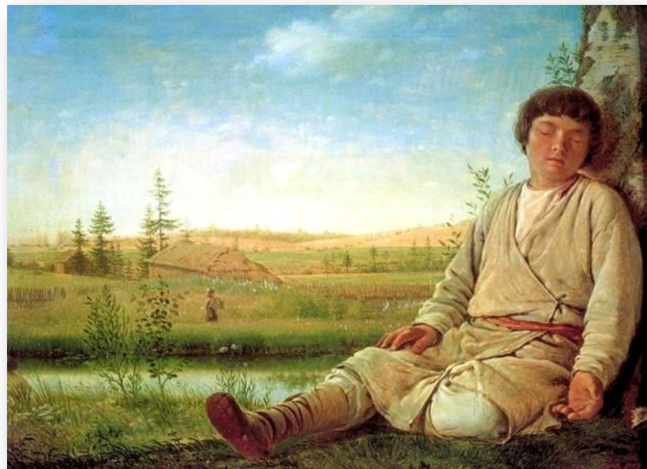
А.Г.Венецианов. Спящий пастушок. 1780

Спит пастушок за день устав, И тьякает чуть слышно пес.