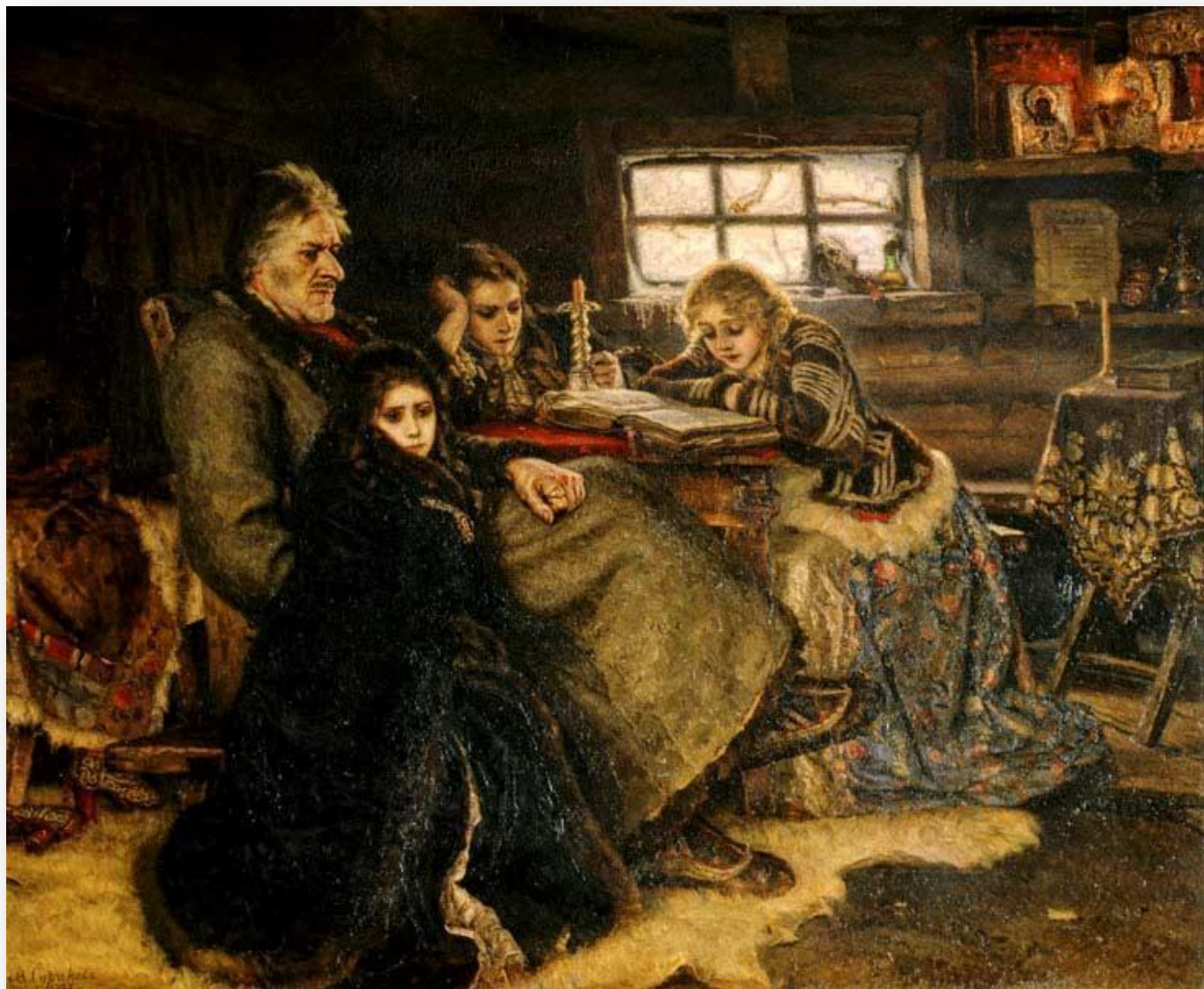
В.Суриков. Меншиков в Березове. 1883

Горизонтальная композиция создает ощущение статичности, спокойствия или движения мимо зрителя