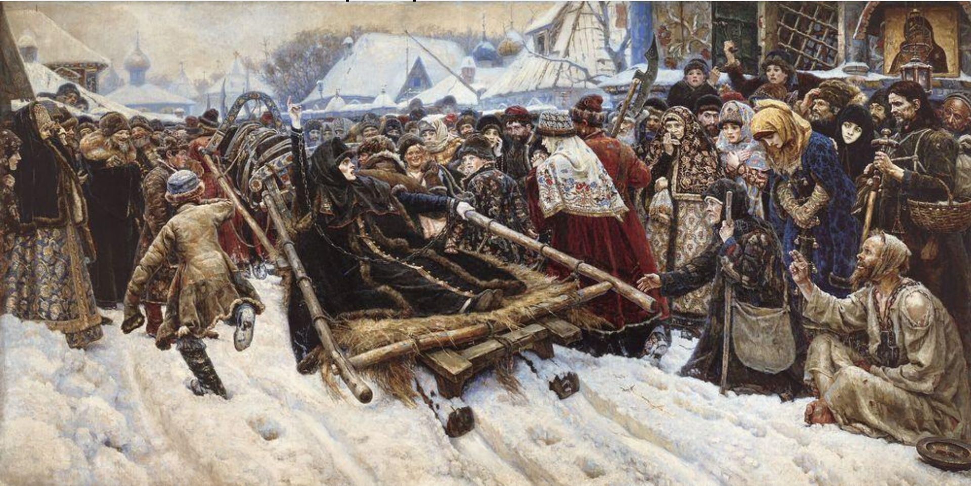
В.Суриков. Боярыня Морозова. 1887

Диагональные композиции передают динамику действия, движение на зрителя или от него и охватывают большие пространства