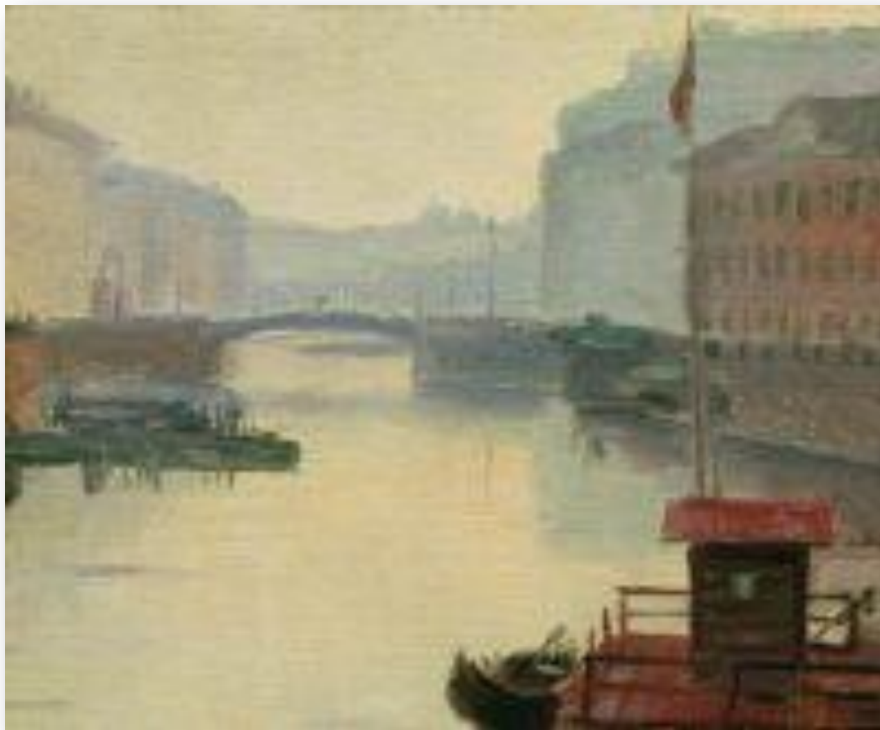
Ф.Васильев. На Мойке. 1871