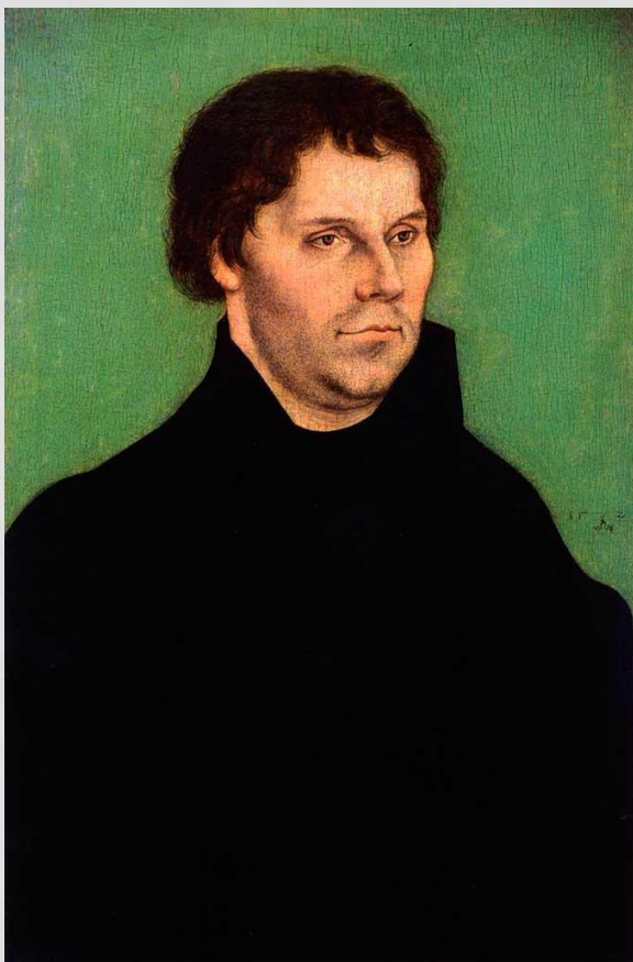
Портрет Мартина Лютера. Художник Лука Кранах Старший, 1525

Мартин Лютер – знаменитый германский церковный реформатор, основатель евангелическо-лютеранской церкви. Родился в Эйслебене (в Саксонии) 10 ноября 1483 года. Он происходил из крестьянского сословия, был сыном рудокопа и получил в семье строгое религиозно-нравственное воспитание.