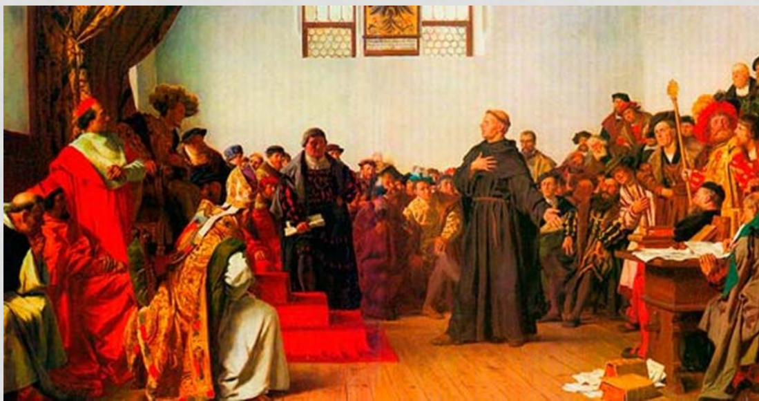
Лютер на Вормсском сейме. Картина А. фон Вернера, 1877

В 1521 г. Мартин Лютер был потребован к ответу пред императором Карлом V и рейхстагом; явившись на имперский сейм в Вормсе, он перед лицом властей и многочисленного народа смело отстаивал свое учение и решительно отклонил предложение отречься от своих идей.