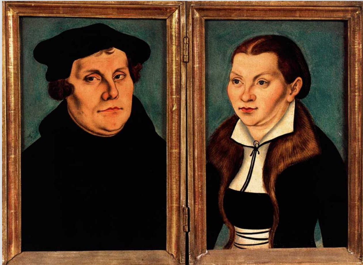
Портрет Мартина Лютера и его жены Катарини Бора. Художник Лука Кранах Старший, 1525

ЛЮТЕР ЖЕНИЛСЯ В 1525 Г. НА 26-ЛЕТНЕЙ КАТАРИНЕ ФОН БОРА