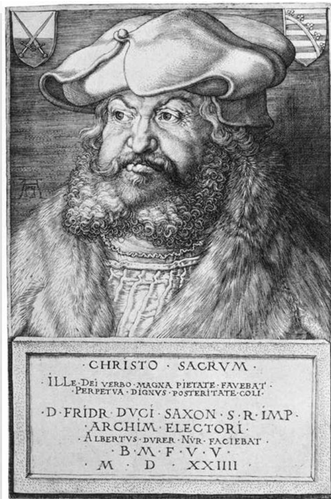
Фридрих Мудрый, курфюрст Саксонии, один из главных сторонников лютеранской реформации. Гравюра А. Дюрера