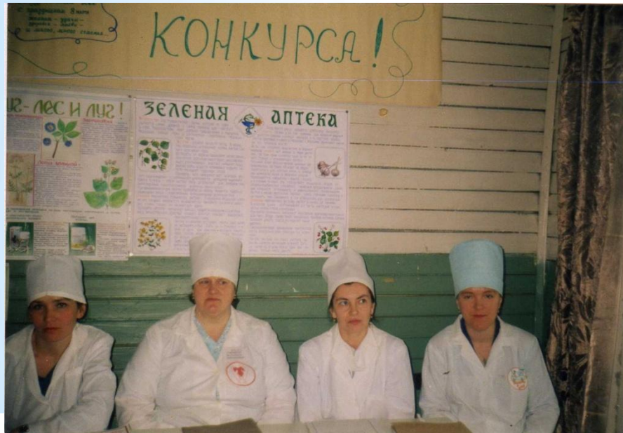
Конкурсанты из Аргуновской, Теребаевской, Завражской и В-Кемской больниц