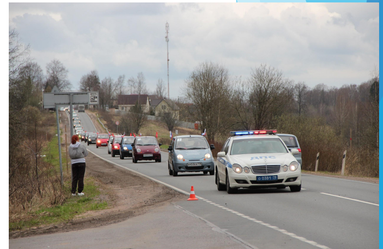
Автопробег «Нам дороги эти позабыть нельзя...»