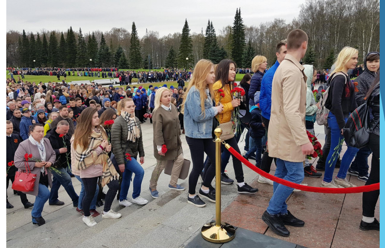
«Памяти павших будьте достойны»