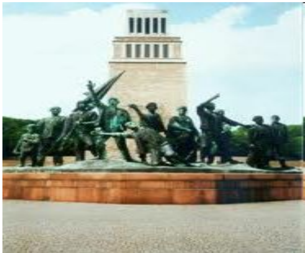
Памятник жертвам фашизма