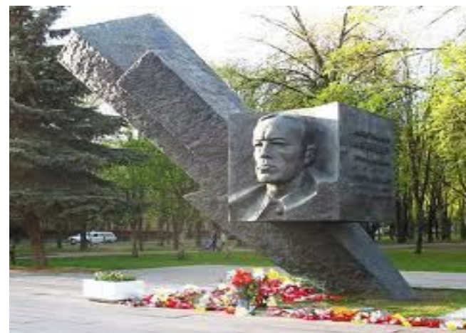
Памятник установлен в Москве на бульваре генерала Карбышева