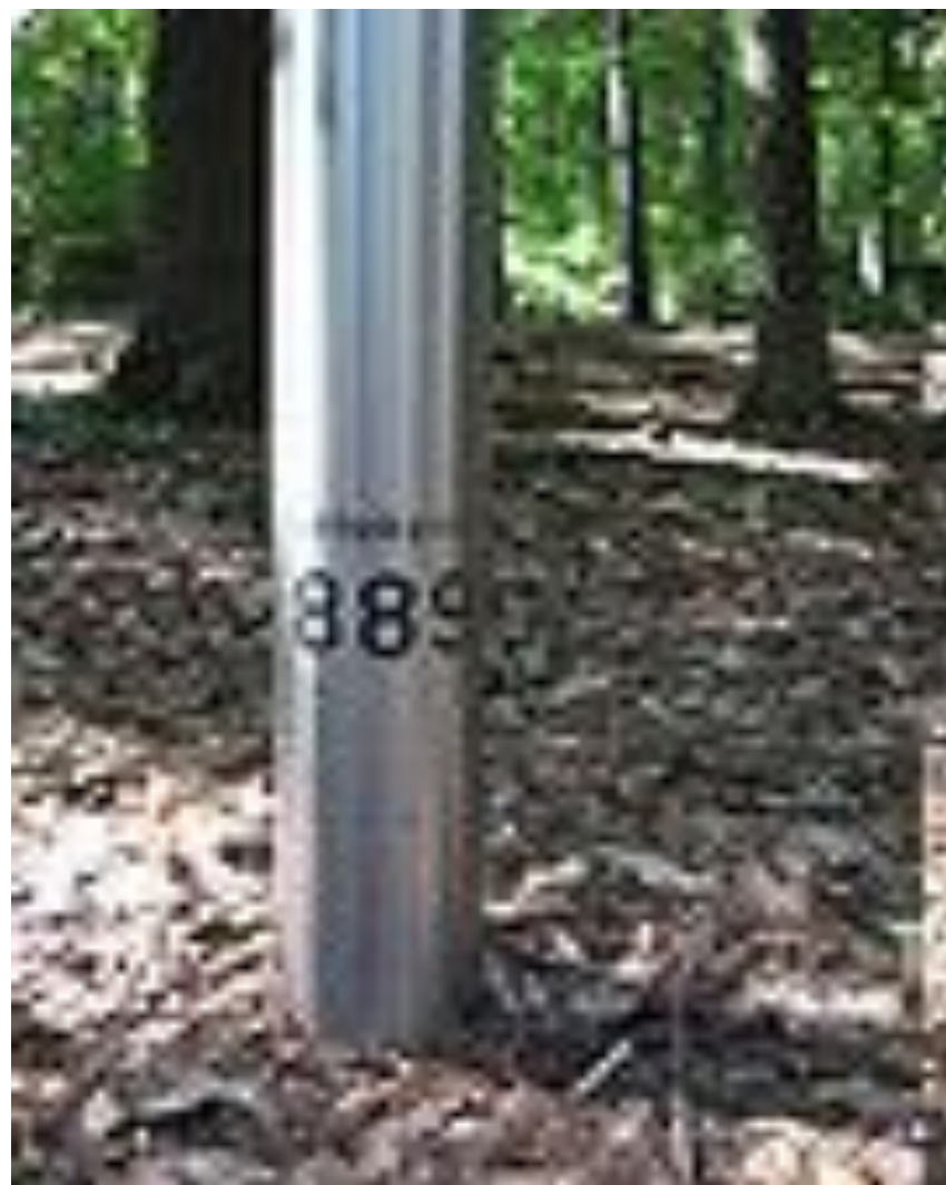
Один из металлических столбов на месте захоронения советского спецлагеря. Надпись: «Неизвестный 889»