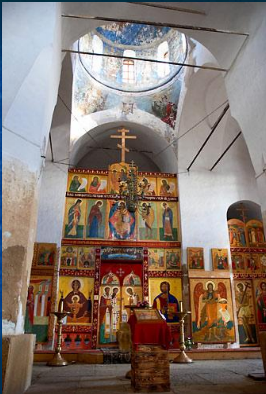
Иконостас Георгиевского храма. (современный вид)