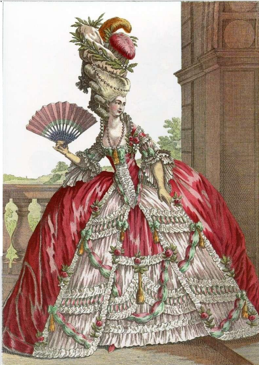
Женский придворный костюм.