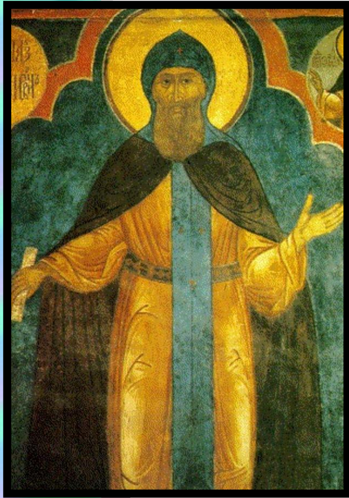
Великий князь Даниил. Фреска Успенского собора Кремля.

Острейшая борьба в н. 14 века развернулась между Москвой и Тве- рью.