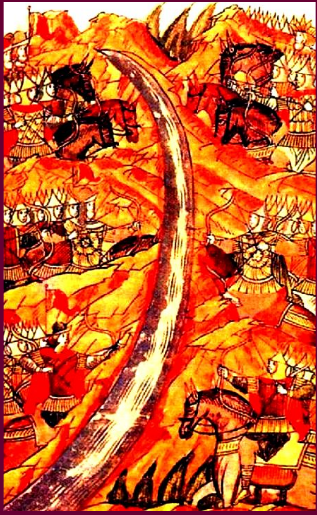
Стояние на реке Угре. Средневековая миниатюра.

Но князь решился выступить навстречу Ахмату. Встреча произошла на р. Угре. Около месяца противники стояли друг против друга и наконец в ноябре Орда повернула в степи.