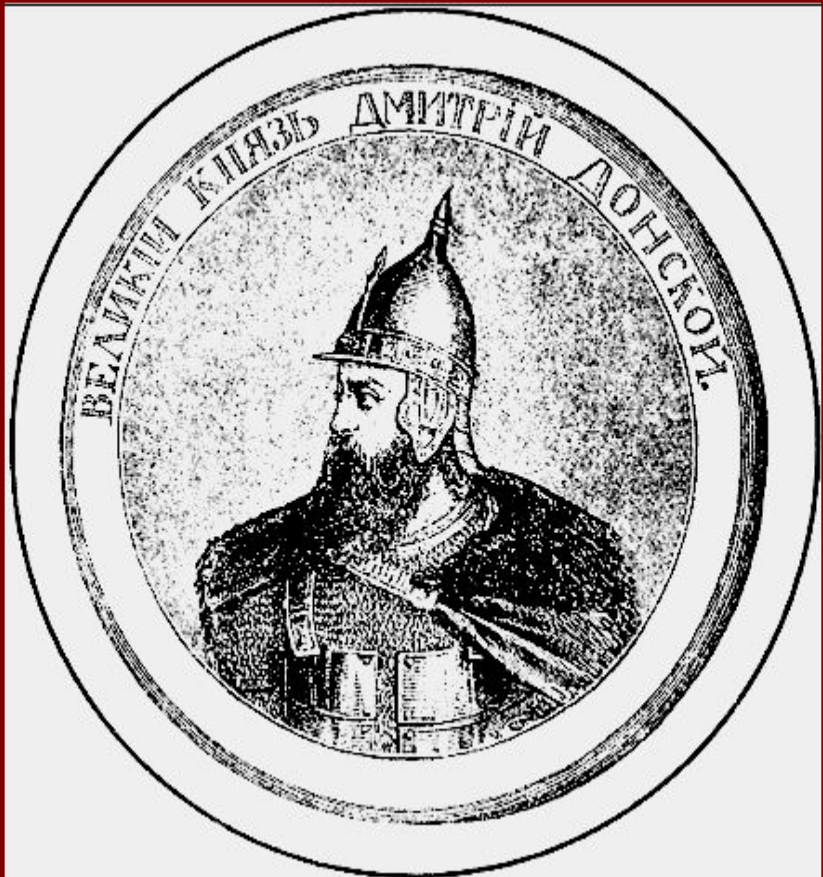
Великий князь Дмитрий. Гравюра XIX в.

В 1375 г. Дмитрий подошел к Твери и тверской князь признал себя «Молодшим братом».