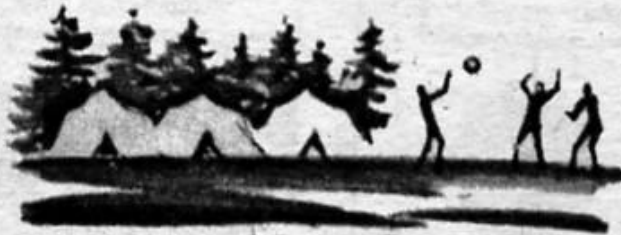
Санітарно-гігієнічні та оздоровчі