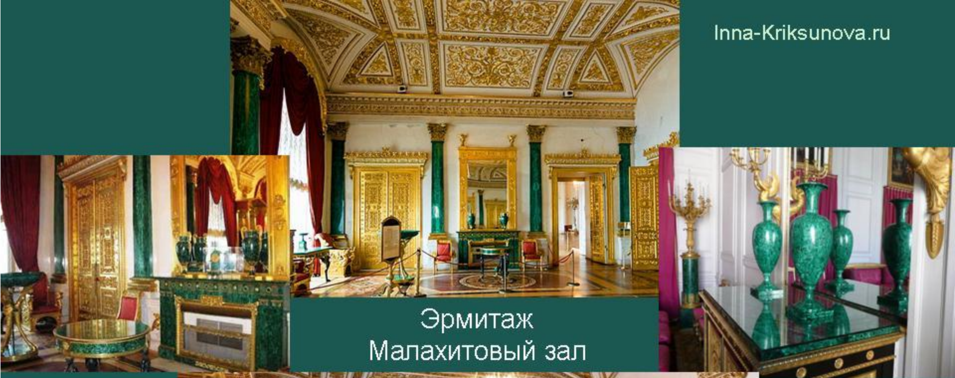
Эрмитаж Малахитовый зал