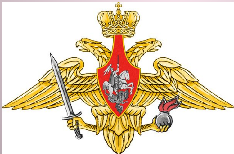
Средняя эмблема СВ