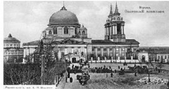
Вид собора в 1898 году