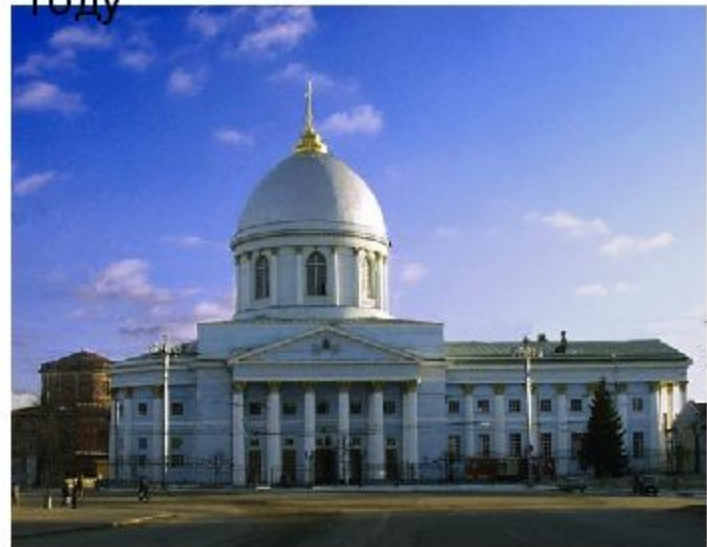
Современный вид собора.