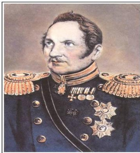
Ф. Ф. Беллинсгаузен