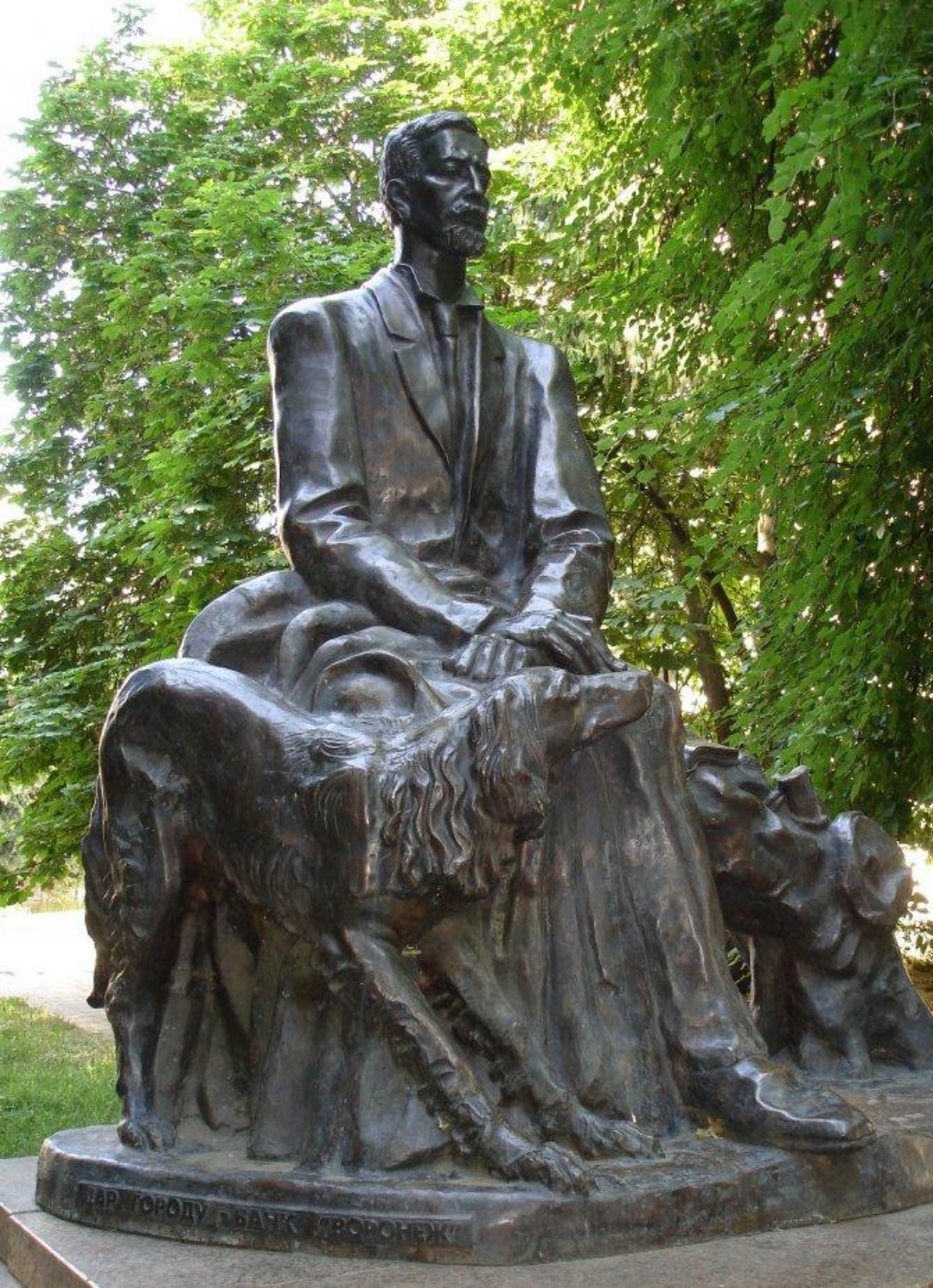
Памятник И.А.Бунину в Воронеже в Бунинском сквере. Скульптор А.И.Бурганов. 1995 г.