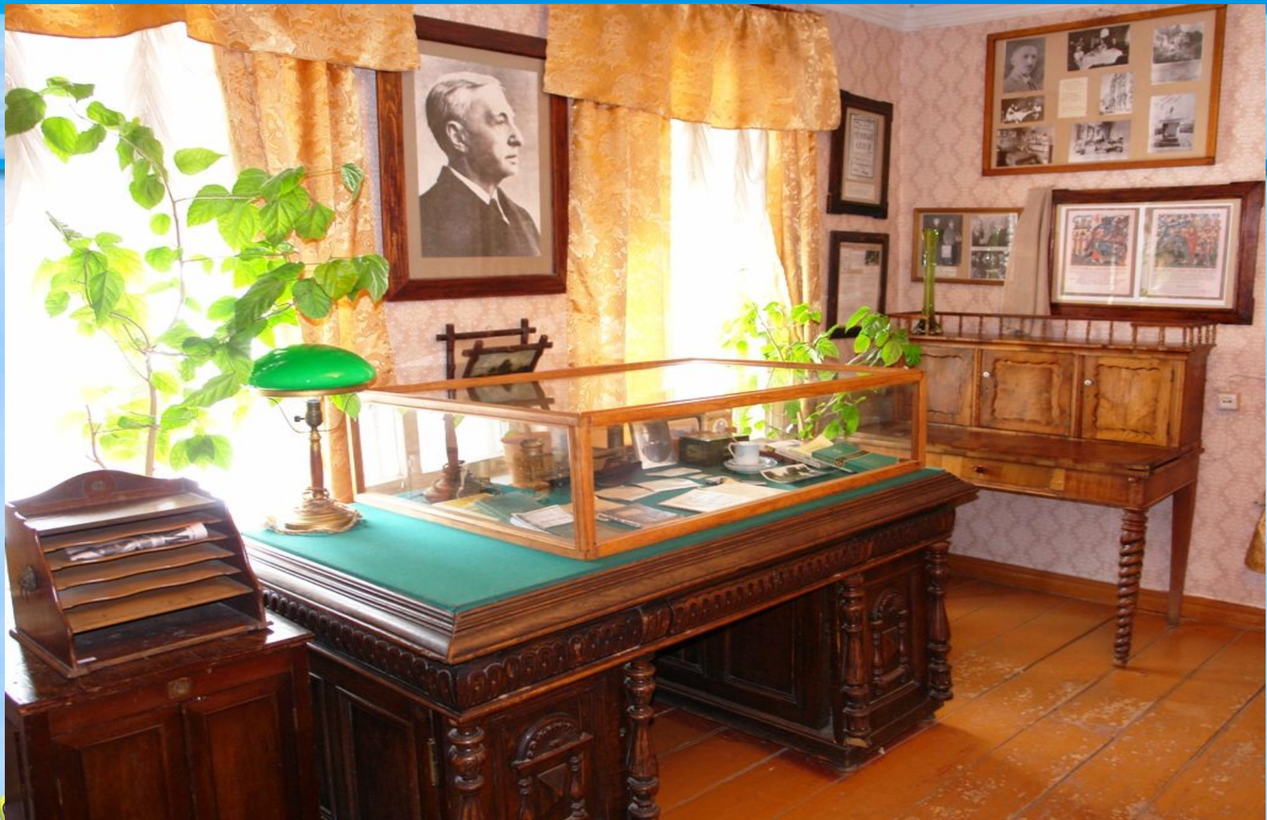
Воссозданный интерьер парижского рабочего кабинета И.А. Бунина.