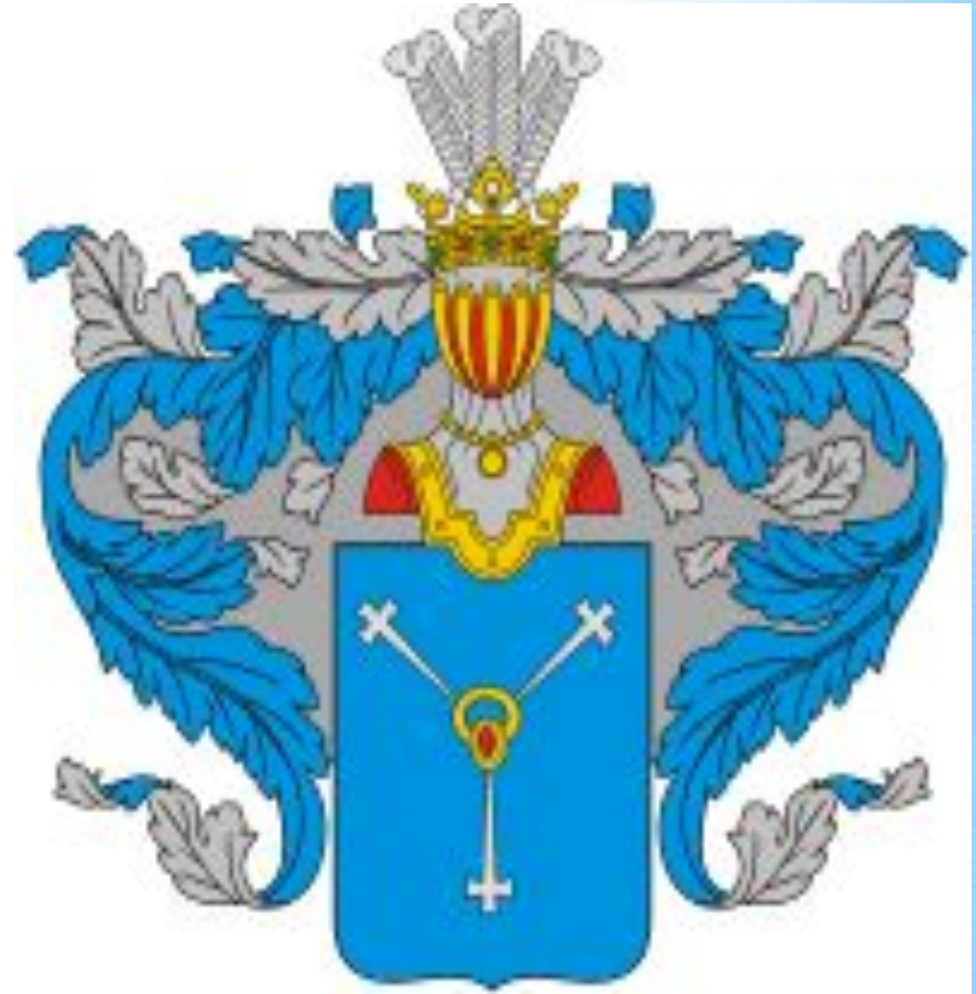
Герб рода Буниных

В «Автобиографических заметках» И.А.Бунин писал: «Я происхожу из старого дворянского рода, о начале которого в «Гербовнике дворянских родов» сказано так: «Род Буниных идёт от Симеона Бунковского, мужа знатного, выехавшего в XV веке из Литвы со своей дружиной на ратную службу к Великому Князю Московскому Василию Васильевичу».